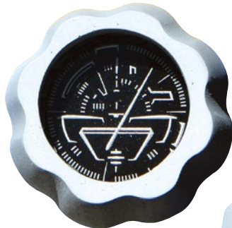
完成版 裏側からリングと文字盤を入れ、 マグネット付きの底フタをネジ止 めてできあがり。