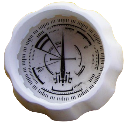
文字盤試作1号 本文で述べた理由により没にしたもの。 作図は『大純情くん』(1977)単行本2巻掲 載のメーターを参考にしました