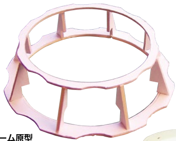
フレーム原型 イラストボードを切り出した パーツを組み合わせ、ウレタン フォームを貼り付けたものをレ ジンキャストに置き換え。