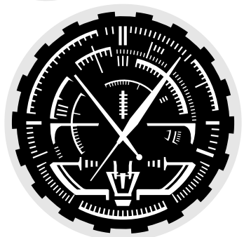
文字盤試作2号(決定稿) 本文で述べた理由により没にしたもの。 作図は『模型の時代』(1978)掲載のメー ターを参考にしました

はなく、そこにメカが存在するこ とを示唆する見立てのベクトルへ 思いっきり振った所になよりの 価値があります。 当初、白地バックに描かれてい た頃は複雑な表情を持つ計器以上 の役割は持たなかった。それが黒 地バックにメーターという組合せ が確立した時からメカの一パーツ という存在を越え、背景美術その ものを担う存在として松本様式を 代表するビジュアルとして定着す るに至った。