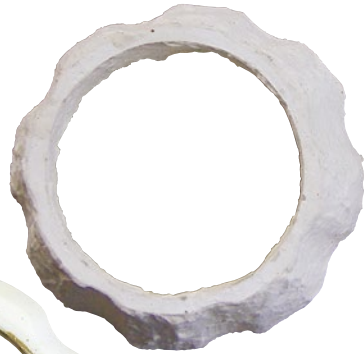
後はひたすら磨いて曲面出し。 磨いていけば、いずれたどり着 くシルエット。