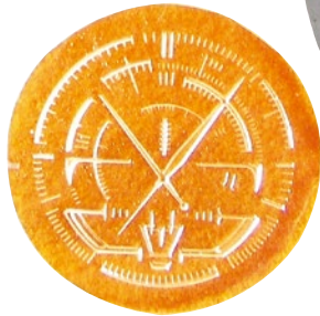
文字盤原型 作図した白黒画像を印刷用樹脂版 「トレリーフ」に転写して凸凹原 版を作成。透明レジンで複製し、 凹部分に白塗料、裏側からお好み の色を塗ってレリーフ状の文字盤 を製作。セルの色塗りと同じなの で、均一な色面が可能。

骨を作って肉を盛って削って整える。 この繰り返しと、手作業で無理な 所は可能な方法でお任せする…… 工業製品的なガレキなら、これで ツメていく事ができるはず。 他力さえ受け入れれば大丈夫。