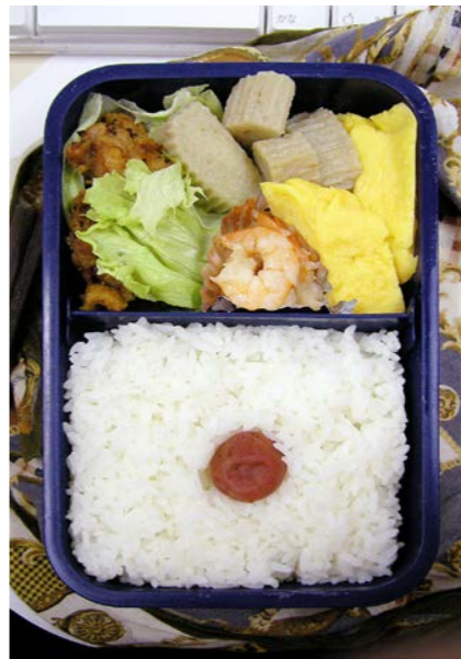
06/09/21/thu 鶏唐揚げ/すぼかまぼこ/玉子焼/海老の甘煮/梅干し レタス