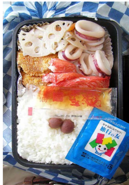
09/03/17/tue イカ・れんこん煮/コロッケ/本物のカニ足?/ふりかけ 小梅