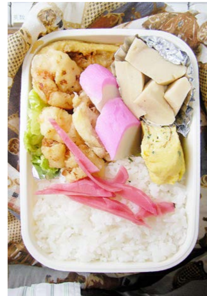
09/10/01/thu エビ・イカ・サツマイモの天ぷら/カマボコ/高野豆腐 玉子焼/キャベツ/紅ショウガ