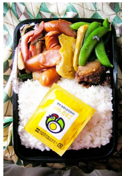
09/04/03/fri ハム・しいたけ炒め/ウインナー/玉子焼/エンドウ豆 サバ?/ふりかけ