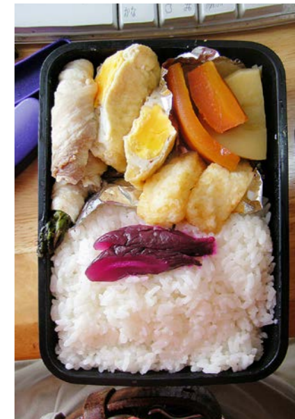
09/03/11/wed アスパラの豚巻き/卵のきんちゃく/ポテトフライ ニンジン・筍煮/キュウリ漬け