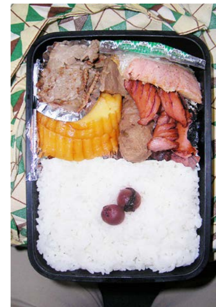
09/01/05/mon 塩ジャケ/ウインナー/ローストビーフ/里芋/だて巻き 小梅