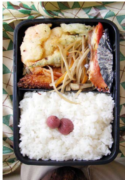
08/07/18/fri エビ・小魚の天ぷら/カニかまフライ/きんぴらごぼう/小梅 サバみりん干し