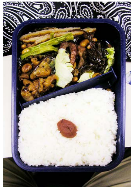
06/09/13/wed 天ぷら/やきとり/鶏・長豆・大豆・昆布の煮物/梅干し レタス