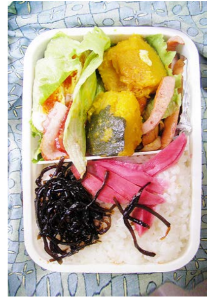
09/12/23/wed 目玉焼/焼き豚/レタス/カボチャ煮/昆布のつくだ煮 ウインナー/紅ショウガ