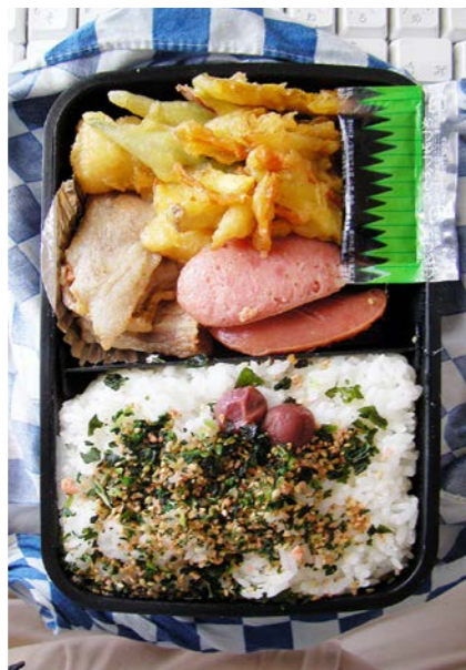
08/09/05/fri 豚バラ焼/イモ・オクラの天ぷら/ウインナー/ふりかけ 小梅