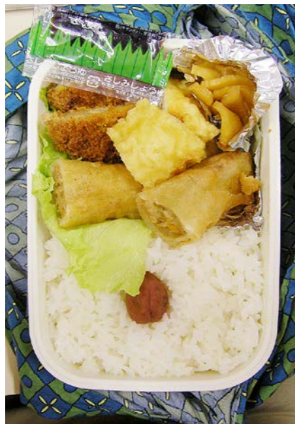
06/12/26/tue トンカツ/春巻/イカの天ぷら/はりはり漬け/梅干し レタス

ソースじゃなくさしみしょうゆなのも一般家庭の弁当ならではの。買い置きなどしてないので前日の刺身パックについての奴が入っていたりする。