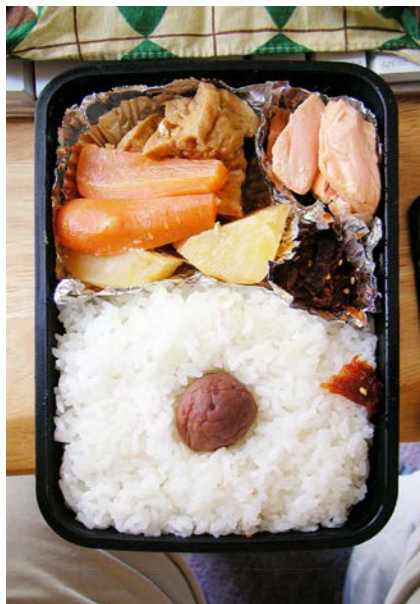
08/07/16/wed 揚げ豆腐・根菜煮／塩ジャケ／昆布・かつおぶしのつくだ煮 梅干し