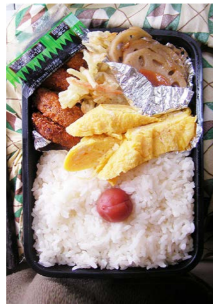
09/01/08/thu 白身魚フライ/かき揚げ/玉子焼/れんこん・ニンジン炒め 梅干し