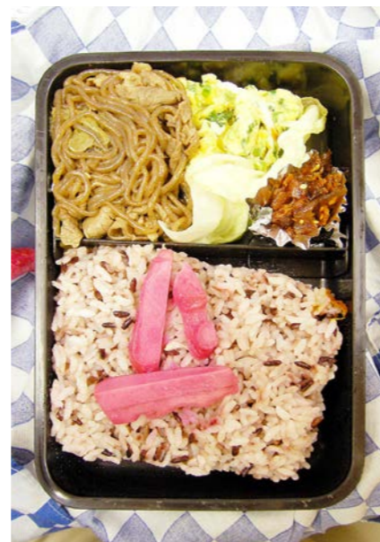
07/07/13/fri 牛・こんにゃく煮／炒り卵／ジャコにつくだ煮／レタス 赤米／紅ショウガ