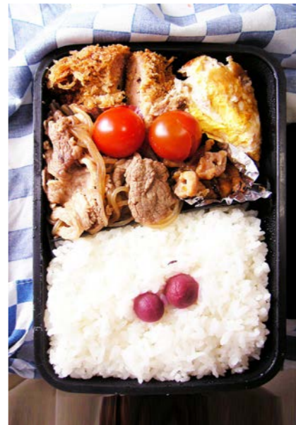
08/06/30/mon トンカツ/牛・こんにゃく煮/焼き鳥/目玉焼/ミニトマト 小梅