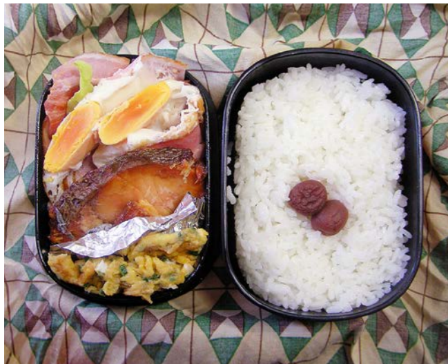
10/12/01/wed ベーコンエッグ/塩ジャケ/炒り卵/小梅