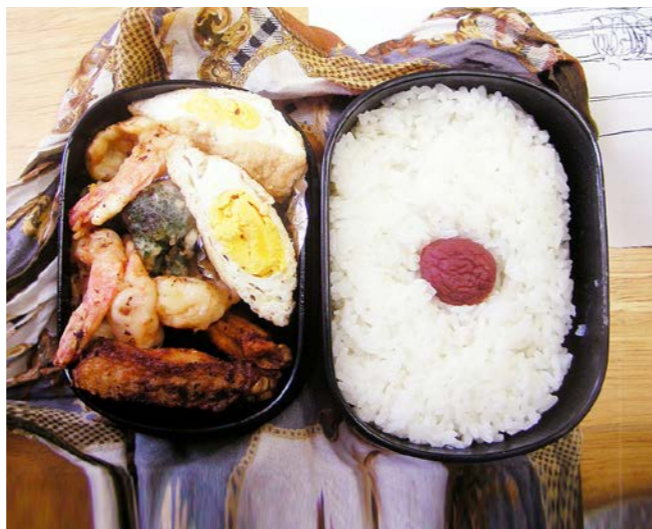
11/02/24/thu 卵のきんちゃく／エビ・アスパラの天ぷら／鶏唐揚げ 梅干し