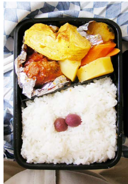
08/07/11/fri ハンバーグ／玉子焼／根菜煮／小梅