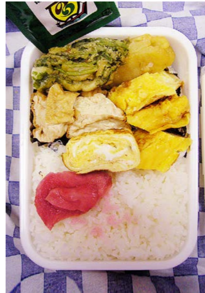
07/04/12/thu いも天?/野菜天/鶏の素揚げ/玉子焼/ふりかけ 紅ショウガ/ふりかけ