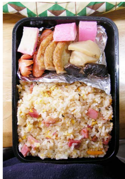
09/01/30/fri かまぼこ/ウインナー/天ぷら・シイタケ煮/チャーハン