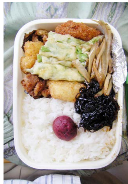
09/07/01/wed 鶏唐揚げ／インゲン豆の天ぷら／きんぴらごぼう／梅干し 一口カツ？／ポテトフライ／昆布のつくだ煮