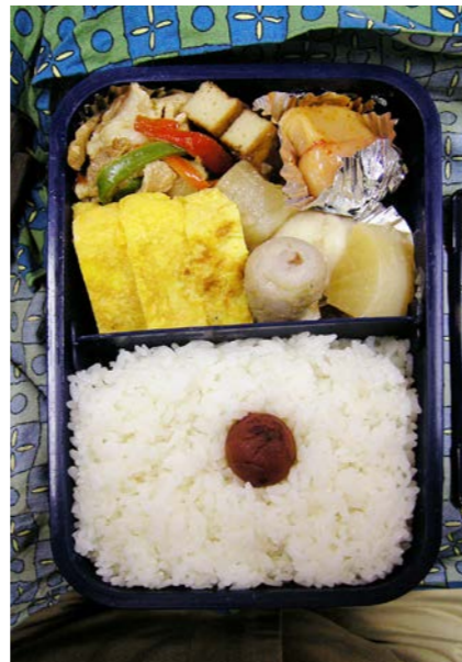
06/11/14/tue 豚・ピーマン炒め/天ぷら/玉子焼/大根・里芋煮/明太子 梅干し