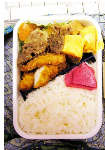
07/01/17/wed 肉じゃが／白身魚フライ／玉子焼／紅ショウガ