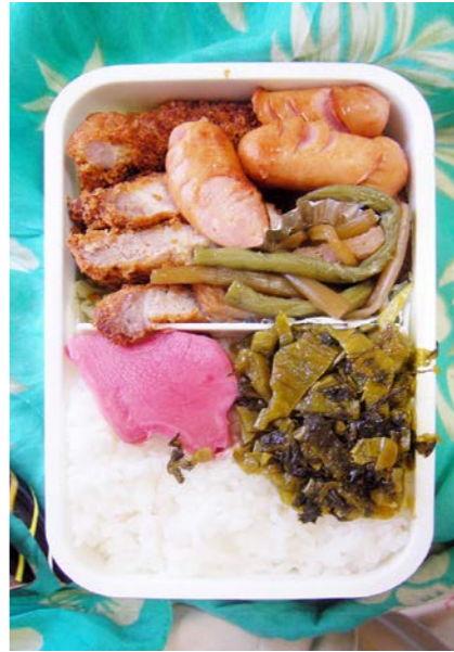
09/10/20/tue トンカツ/ウインナー/フキ・丸天煮/高菜炒め/紅ショウガ