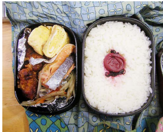
10/05/10/mon 鶏唐揚げ／玉子焼／きんぴらごぼう／塩ジャケ／梅干し