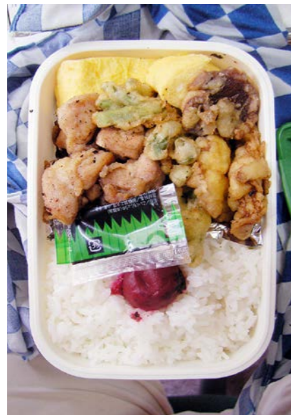
09/08/12/wed 玉子焼／鶏唐揚げ／シイタケ・インゲン・サツマイモの天ぷら 梅干し