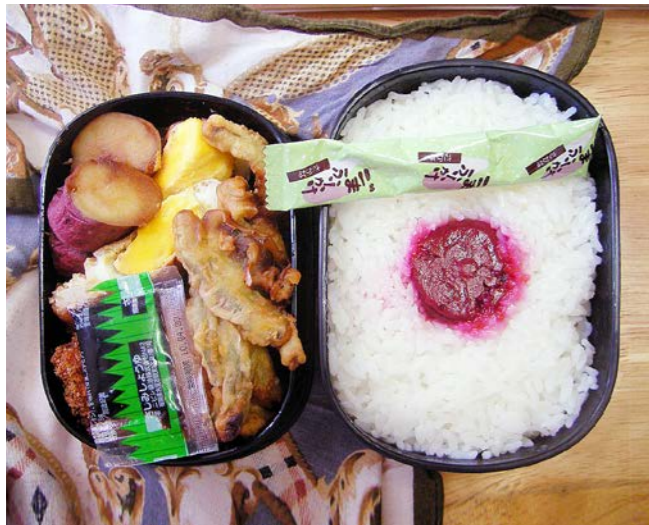
10/05/17/mon サツマイモ煮／目玉焼／トンカツ？／キビナゴの天ぷら ふりかけ／梅干し