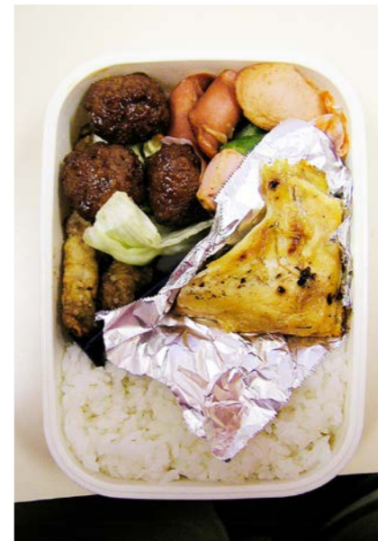
07/01/29/mon ミートボール/ウインナー・ベーコン・キュウリ炒め/レタス エノキの豚バラ巻?/焼シャケ