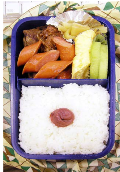
06/08/01/tue 猪の煮物/ウインナー/玉子焼/ふきの煮物/キウイ/梅干し