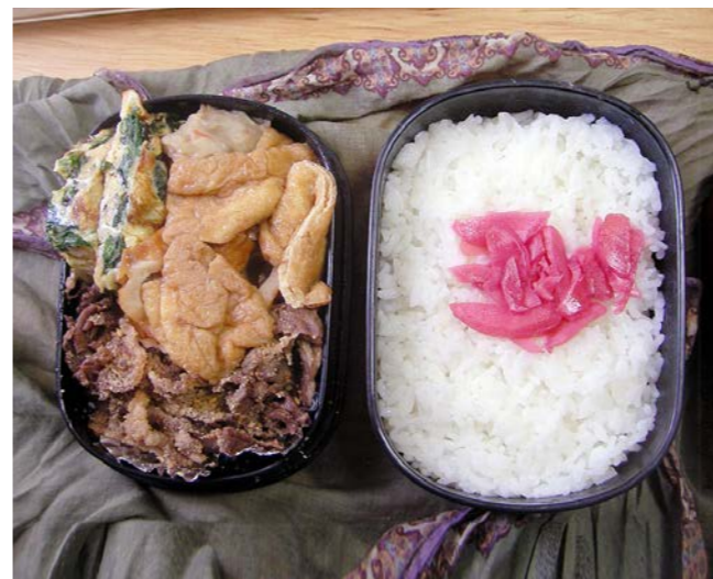
11/01/31/mon 炒り卵／牛煮／油揚げ・野菜天煮／紅ショウガ