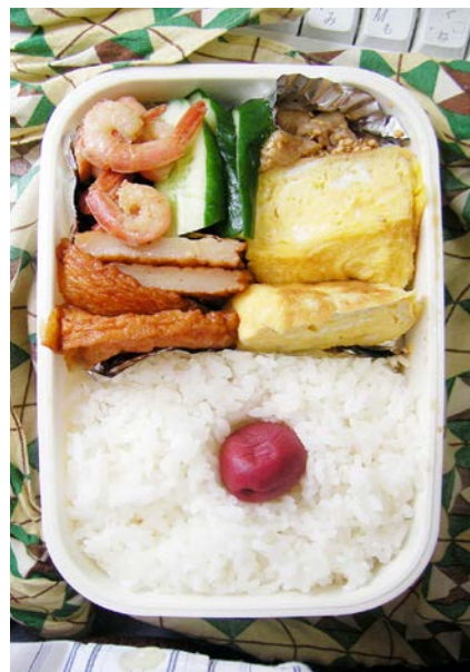
09/07/06/mon エビ・丸天煮／玉子焼／豚肉炒め／キュウリ／梅干し