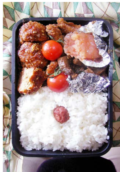
09/01/09/fri 肉団子/鶏唐揚げ/鶏レバー/明太子/ミニトマト/梅干し