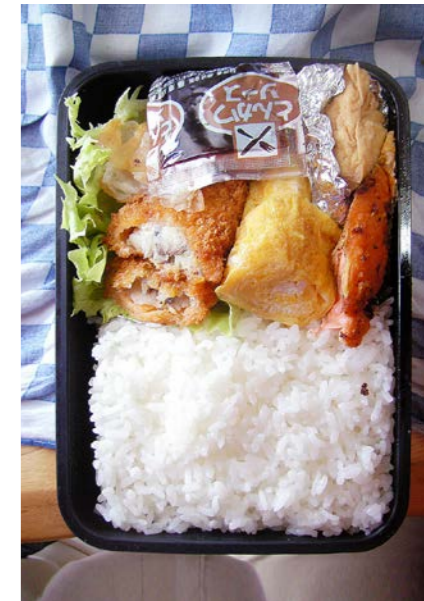
09/03/02/mon 白身魚フライ/玉子焼/塩ジャケ/揚げ豆腐/レタス