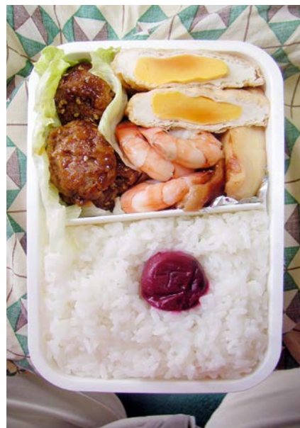
10/01/08/fri 肉団子/卵の厚揚げ煮/エビ煮/ちくわ/レタス/梅干し