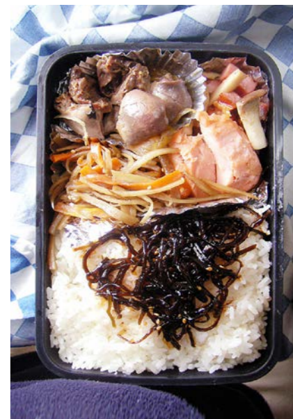
09/01/27/tue 鶏レバー/きんぴらごぼう/塩ジャケ/ハム・シメジ炒め 昆布のつくだ煮