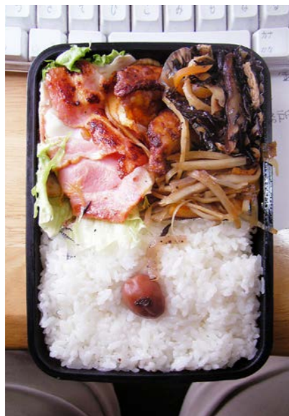
09/02/17/tue ベーコンエッグ/ひじき和え/きんぴらごぼう/レタス 梅干し