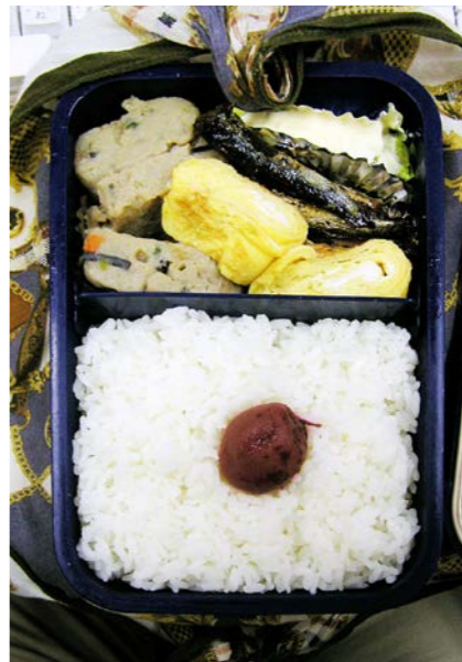
06/09/16/sat すり身煮/玉子焼/小魚のつくだ煮/ゆでカリフラワー 梅干し