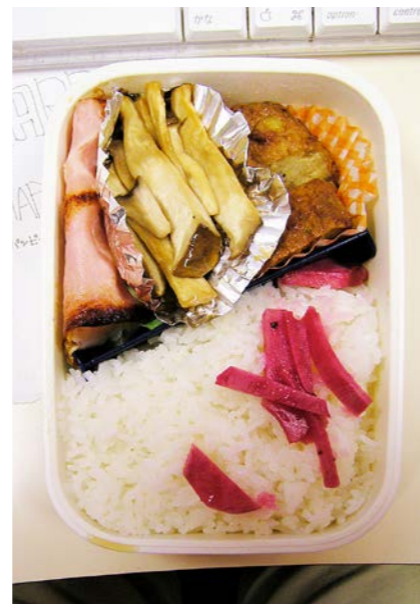
07/01/19/fri ベーコンエッグ／エリンギ炒め／豆腐ハンバーグ 紅ショウガ