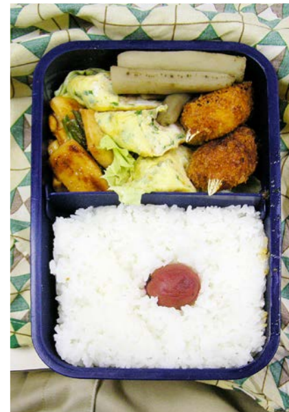
06/07/24/mon イカとニラのピリ辛炒め/玉子焼/ゴボウ煮/梅干し/カニクリームコロッケ/レタス