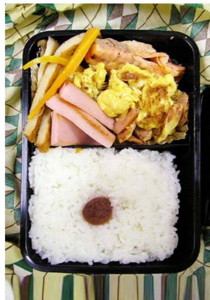
07/07/06/fri ニンジン・丸天煮/魚肉ソーセージ/ウインナー・炒り卵 塩ジャケ