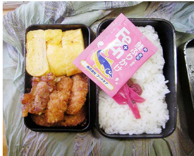
10/08/16/mon 玉子焼／鶏唐揚げ／コロッケ／紅ショウガ／ふりかけ 梅干し