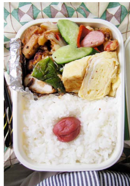
09/07/02/thu 鶏唐揚げ／ちくわ・カニかま刺し大葉の天ぷら／玉子焼 魚肉ソーセージ・プレスハム炒め／梅干し