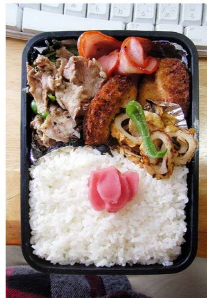
08/11/19/wed 豚・ピーマン炒め/プレスハム/コロッケ/焼ちくわ 紅ショウガ