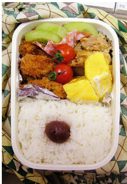
07/02/13/tue カキフライ/キウイ/ミニトマト/ホタテ煮/玉子焼/梅干し