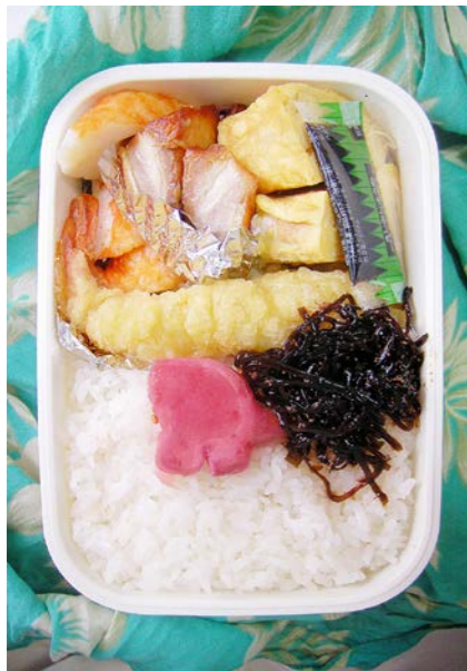
09/10/07/wed エビ天/ちくわ/天ぷら/豚角煮/玉子焼/紅ショウガ 昆布のつくだ煮