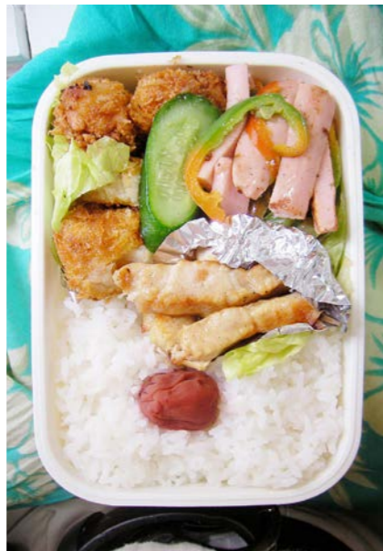
09/10/06/tue コロッケ/魚肉ソーセージ・キュウリ・ピーマン炒め/梅干し エリンギ天?/キャベツ