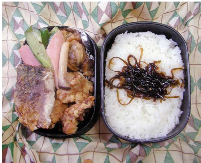
11/02/01/tue 鶏唐揚げ／サバ唐揚げ／エリンギ・ソーセージ・キュウリ炒め アサリ煮？／昆布のつくだ煮