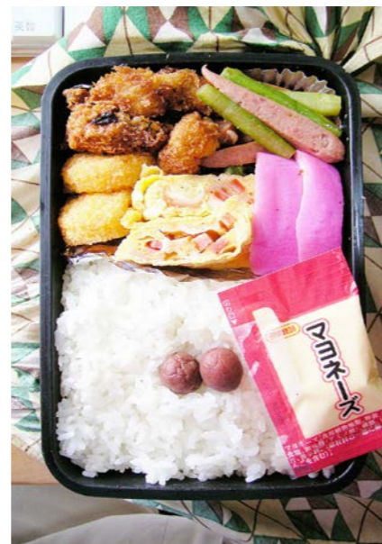
09/04/06/mon コロッケ/エビフライ(カキ?) /ウインナー・アスパラ炒め かまぼこ/玉子焼/小梅