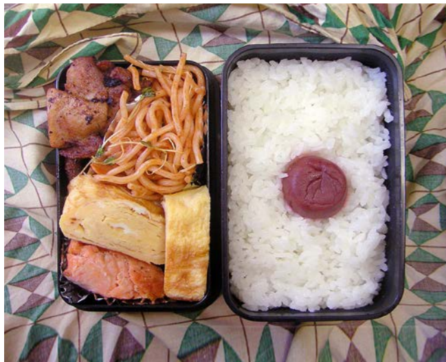
10/09/03/fri 鶏唐揚げ/玉子焼/塩ジャケ/スパゲティ/梅干し