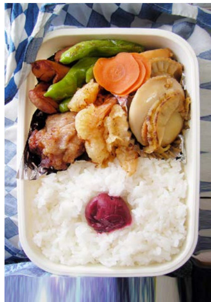
09/08/17/mon ウインナー／鶏唐揚げ／シシトウ／エビ天ぷら／梅干し ホタテ・ニンジン煮