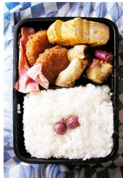
08/09/04/thu ベーコン/コロッケ/玉子焼/イモの素揚げ?/小梅