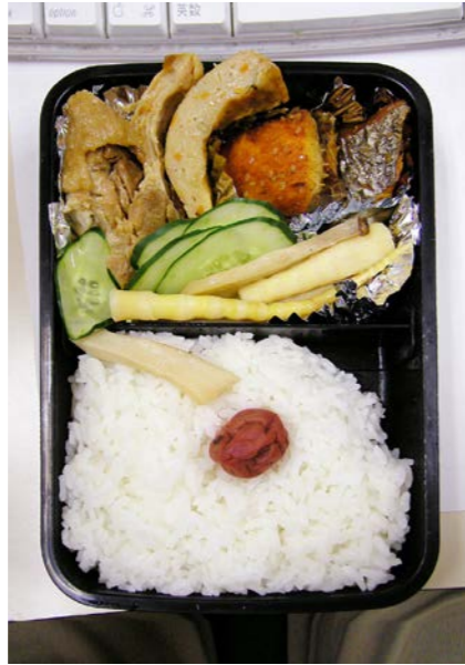
07/08/02/tue 鶏・天ぷら・筍・エリンギ煮/キュウリ/サバみりん干し梅干し