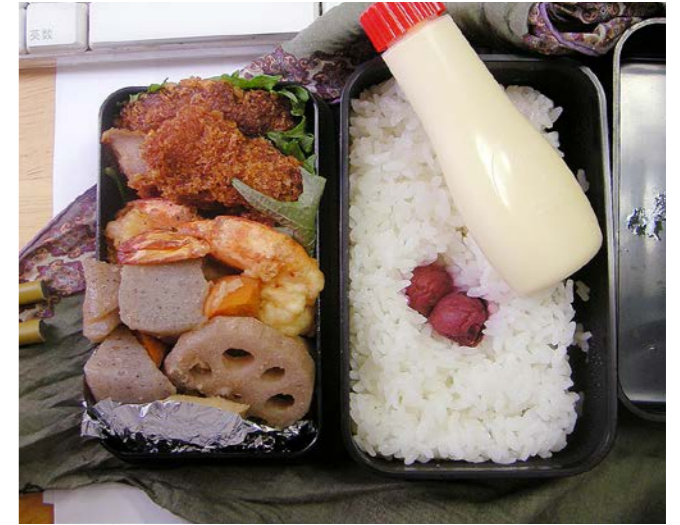
10/07/12/mon 串カツ/エビ天/コンニャク・ニンジン・レンコン煮/大葉 小梅