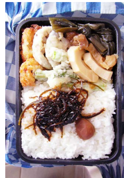
09/04/21/tue コロッケ/レンコン・アスパラ天/昆布のつくだ煮/梅干し 昆布・筍・牛スジ・厚揚げ煮