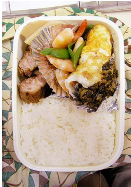
07/04/17/tue 野菜天・箱煮/エビとエンドウ豆煮/目玉焼/高菜炒め