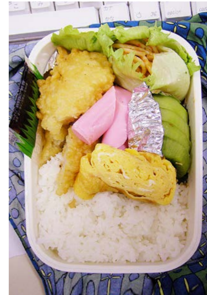
07/04/03/tue イカフライ/ソーセージ/玉子焼/スパゲティ/キウイ レタス