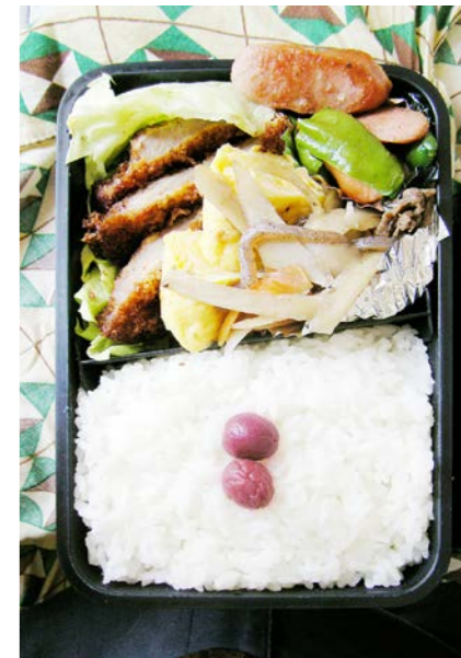
08/07/09/wed トンカツ／玉子焼／ピーマン・魚肉ソーセージ炒め／小梅 牛・こんにゃく入りきんぴら／レタス