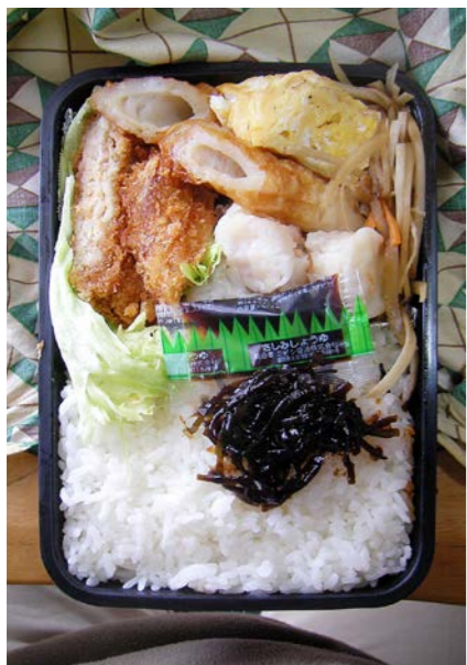
09/02/18/wed 自身魚フライ/ちくわ/シュウマイ/玉子焼/レタス きんぴらごぼう/昆布のつくだ煮