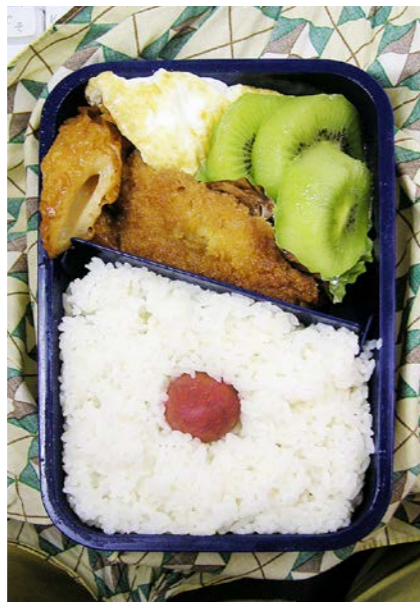
06/08/03/thu ちくわ煮/白身魚フライの甘煮/目玉焼/キウイ/梅干し

天ぶらの単体表記は九州以外でさつま揚げとかすり身揚げと呼ばれるもの(丸いのは丸天と呼称)。