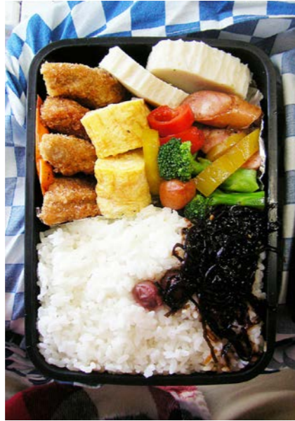
08/12/01/mon トンカツ/玉子焼/すぼかまぼこ/昆布のつくだ煮/小梅 ウインナー・ピーマン・ブロッコリー炒め