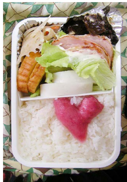
10/01/07/thu ハス・ニンジン酢の物/だて巻き/マグロ角煮?/レタス ロースハム/カマボコ/紅ショウガ