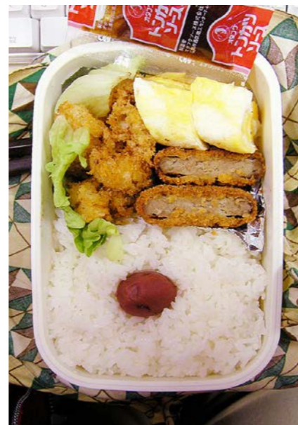
07/02/01/thu エビフライ?/ミンチカツ/玉子焼/梅干し/レタス