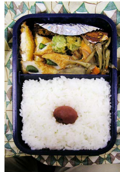
06/10/31/tue 白身魚フライ/ちくわ(いんげんまめ刺し)/焼き魚/梅干し ゴボウとニンジンのきんぴら