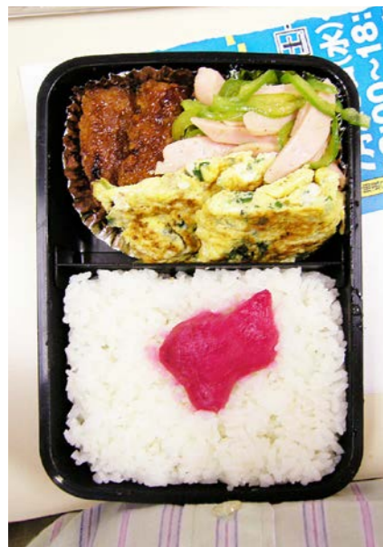
07/07/09/mon ハンバーグ/玉子焼/魚肉ソーセージ・ピーマン炒め 紅ショウガ