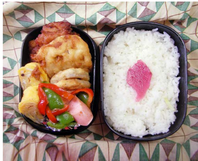
10/11/30/tue 鶏唐揚げ/レンコンの天ぷら/玉子焼/紅ショウガ ソーセージ・ピーマン炒め