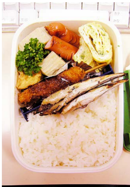
07/01/24/wed 揚げ豆腐・すばかまぼこ煮／ウインナー／串カツ／玉子焼 干シアゴ／パセリ