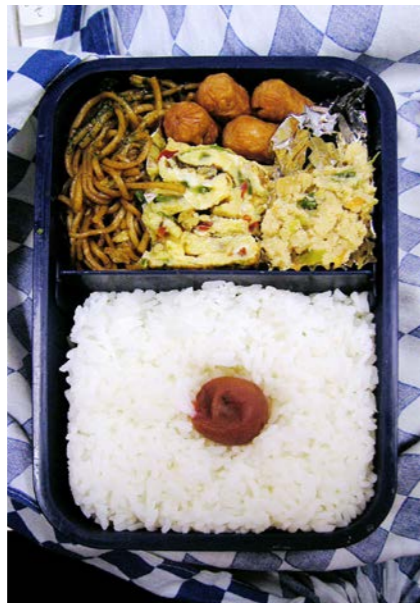
06/10/11/wed 焼きそば/ウインナー/玉子焼/おから/ノリつくだ煮 梅干し