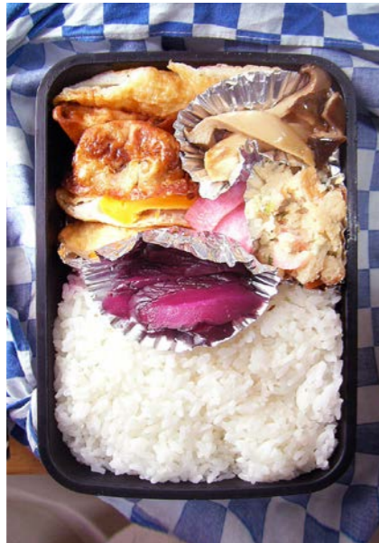
09/03/09/mon ちくわ・シイタケ煮/目玉焼/かまぼこ/キュウリ漬け おから