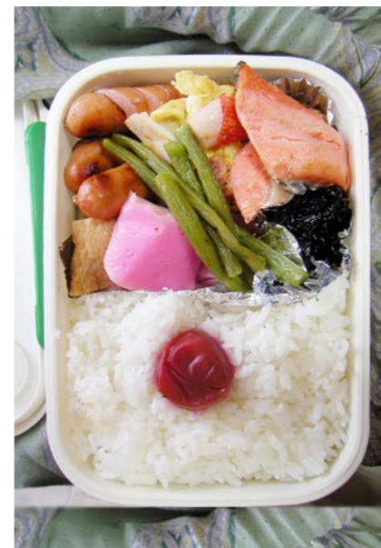
09/06/30/tue ウイナー／炒り卵／カニかま／塩ジャケ／かまぼこ 天ぷら／インゲン豆炒め／昆布のつくだ煮