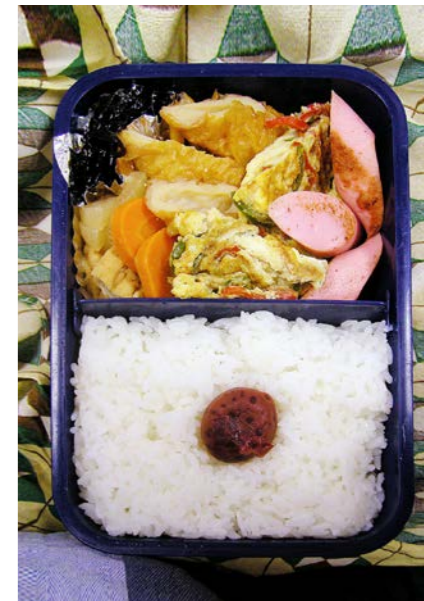
06/10/30/mon ちくわ・油揚げ・ニンジン・大根煮/玉子焼/梅干し 魚肉ソーセージ/昆布のつくだ煮