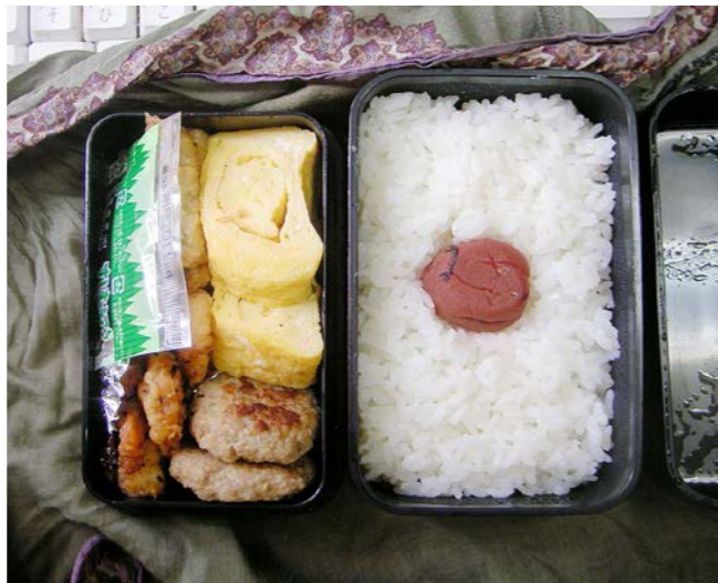
10/09/02/thu 玉子焼/ミニハンバーグ/鶏唐揚げ/なにかの天ぷら 梅干し