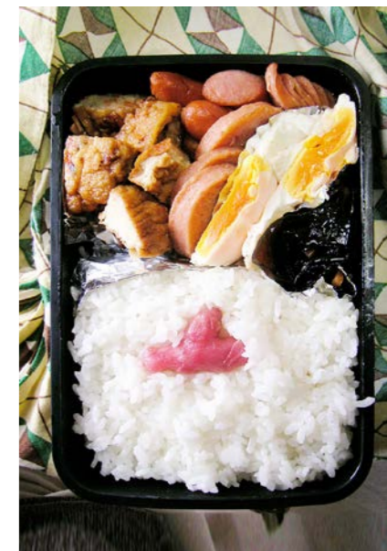
08/11/17/mon 野菜天・揚げ豆腐煮/ウインナー/魚肉ソーセージ/目玉焼 昆布のつくだ煮/紅ショウガ