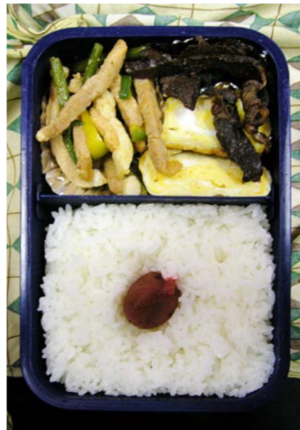
06/11/24/fri 豚・ピーマン・ニンニクの茎炒め/玉子焼/塩鯨/梅干し