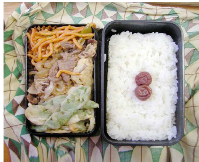
10/10/28/thu 肉炒め/エンドウ豆の天ぷら/スパゲティ/小梅