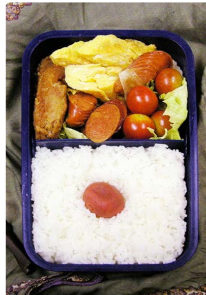
06/07/27/thu 揚げ手羽元/揚げウインナー/玉子焼/ミニトマト/梅干し/レタス