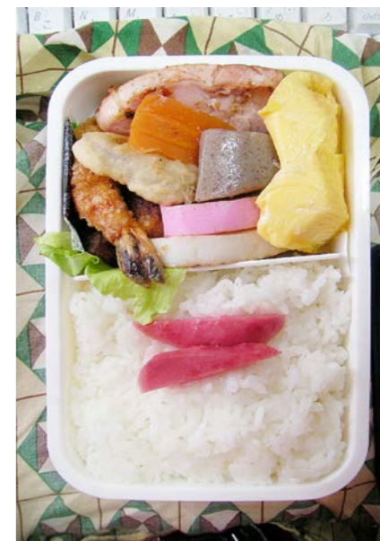
10/01/02/sat エビフライ/ロースハム/ニンジン・こんにゃく煮/玉子焼 カマボコ/鶏唐揚げ/ハス天ぷら/レタス紅ショウガ