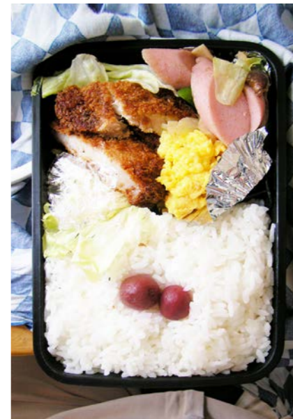
08/07/10/thu トンカツ／炒り卵／ピーマン・魚肉ソーセージ炒め／レタス 小梅