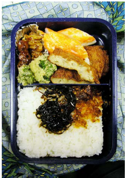
06/11/28/tue やきとり/かまぼこ/天ぷら/カリフラワーの天ぷら/昆布・かつお節・マグロのつくだ煮