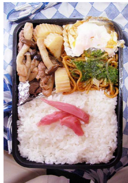
09/02/13/fri 牛・しめじ・すばかまぼ煮/目玉焼/焼きそば 紅ショウガ