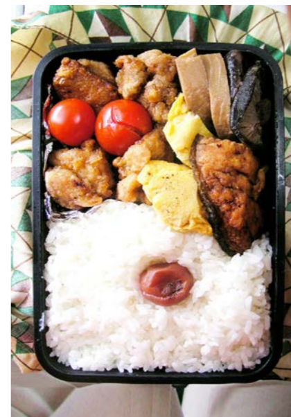
09/01/06/tue 鶏唐揚げ/玉子焼/筍・しいたけ煮/梅干し/揚げサバ?