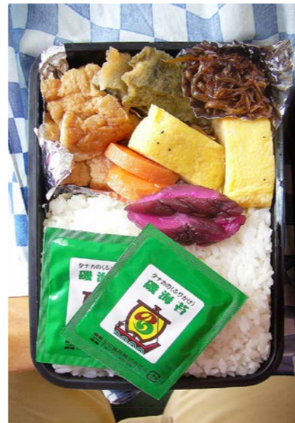
09/03/16/mon 揚げ豆腐・ニンジン煮/ニンジン葉の天ぷら/玉子焼 キビナゴのつくだ煮/キュウリ漬け/ふりかけ