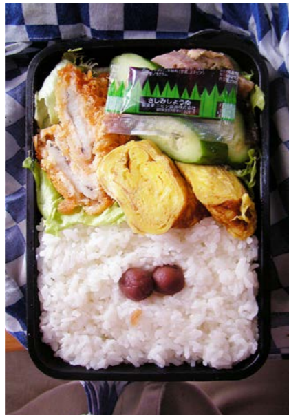
09/03/18/wed 白身魚フライ/玉子焼/魚肉ソーセージ・豚肉炒め? キュウリ/レタス/小梅