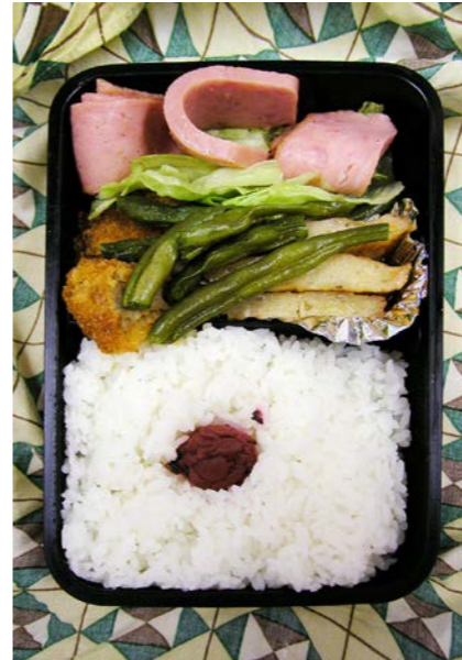
07/07/31/tue ハム・インゲン豆炒め/ミンチカツ/天ぷら/キャベツ梅干し