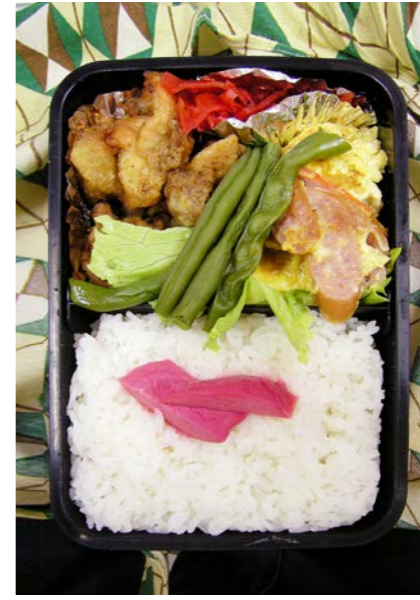
07/07/30/mon 鶏唐揚げ/インゲン豆/福神漬け/ウインナー・炒り卵紅ショウガ