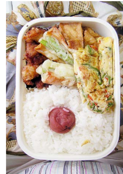
09/09/29/tue 鶏唐揚げ/ちくわ・アスパラ天/揚げ豆腐煮/玉子焼 梅干し