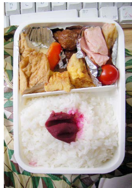
10/01/06/wed 揚げ豆腐・ニンジン煮/玉子焼/ミートボール/塩ジャケ ミニトマト/梅干し