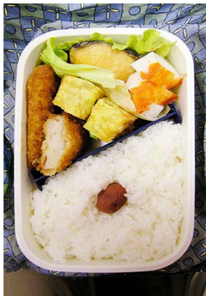
07/01/22/mon 白身魚フライ／玉子焼／塩ジャケ／かまぼこ／梅干し レタス