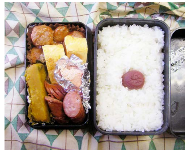
10/10/27/wed 肉団子/玉子焼/ウインナー/焼タラコ/カボチャ煮 梅干し