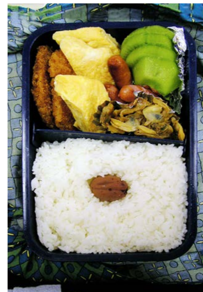
06/11/10/fri トンカツ/玉子焼/ウィンナー/アサリ煮/キウイ/梅干し