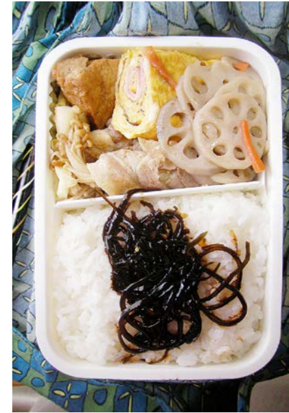
09/12/22/tue エノキの豚バラ巻/揚げ豆腐煮/玉子焼/昆布のつくだ煮 レンコン・ニンジン煮/イカが入ってる?