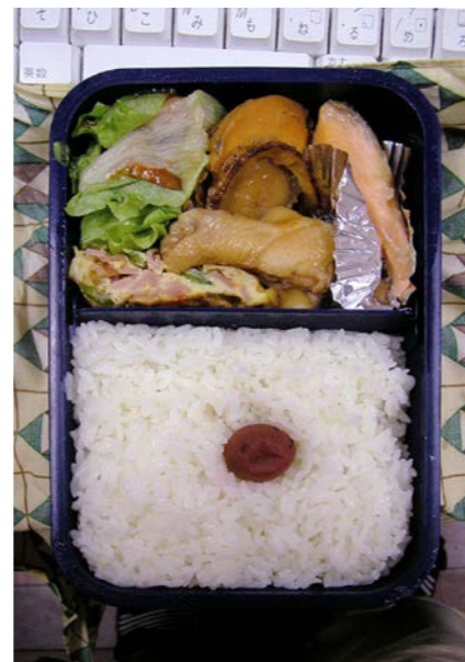
06/11/04/sat やきとり/ほたて・にわとり煮/塩ジャケ/玉子焼/梅干し レタス