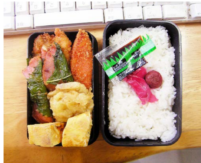
10/08/10/tue 玉子焼／ハムの大葉巻／カニかまフライ／コロッケ／梅干し 紅ショウガ