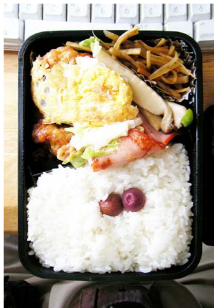
08/07/07/mon 鶏唐揚げ/ベーコンエッグ/ピーマン・ハム炒め/小梅 きんぴらごぼう/レタス