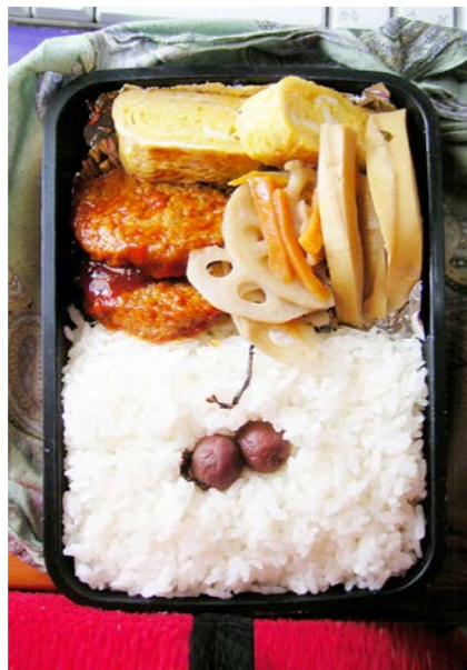
09/04/27/mon ハンバーグ/玉子焼/レンコン・筍・ニンジン煮/小梅