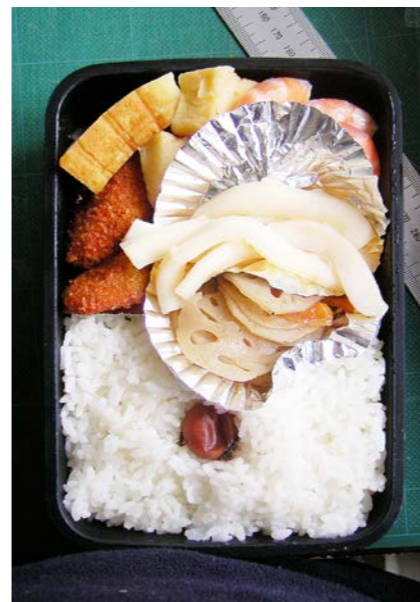
09/01/07/wed 玉子焼/天ぷら・エビ煮/白身魚フライ/イカー夜干し れんこん・ニンジン炒め/小梅