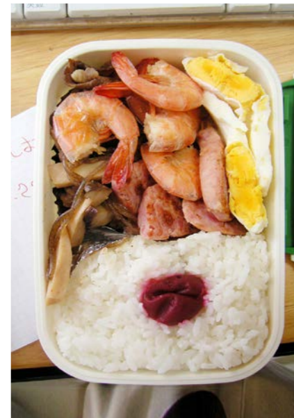
09/08/07/fri エビ・エリンギ・牛肉・コンニャク煮／魚肉ハム／目玉焼 梅干し