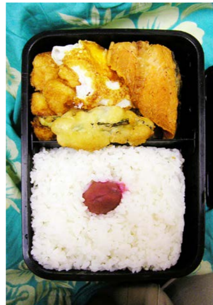
07/07/03/tue カニかまフライ/ナス天ぷら/目玉焼/塩ジャケ/梅干し