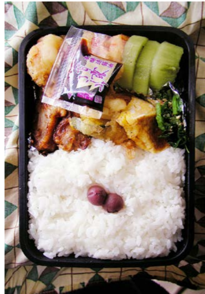
09/03/06/fri ピリ辛チキン/エビ・野菜天/キウイ/玉子焼/青菜漬け 小梅