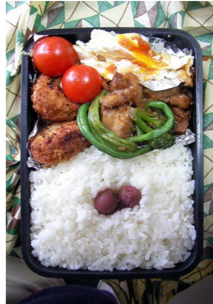
08/11/27/thu コロッケ/鶏・ブロッコリー・いんげん豆煮/目玉焼/小梅 ミニトマト