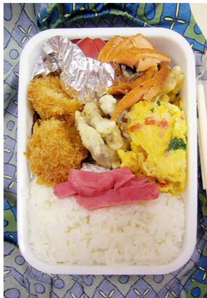
07/03/30/fri コロッケ?/レンコンの天ぷら/塩ジャケ/炒り卵/トマト 紅ショウガ