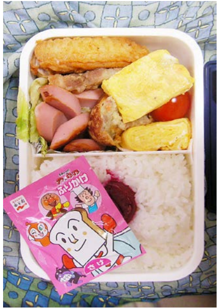
09/12/30/wed 揚げ手羽元/魚肉ソーセージ/玉子焼/コロッケ/レタス ミニトマト/ふりかけ/梅干し