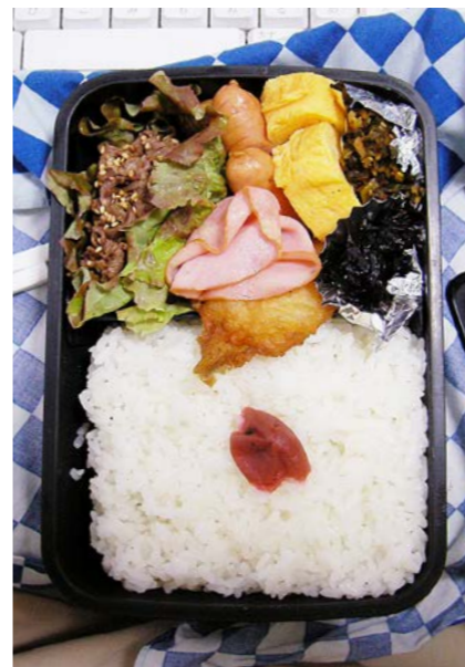
08/05/19/mon 牛甘煮/ウインナー/玉子焼/プレスハム/白身魚天ぷら 高菜炒め/昆布のつくだ煮/梅干し

08年3月に会社分裂、新事務所に移転という一大転機が訪れる。隔当たりのいい部屋だったので写真も明るめになる。環境の変化も弁当の中身には及ばなかった。