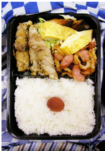
07/07/18/wed エノキの豚バラ巻／サワラのみりん干し／玉子焼／梅干し ちくわ・ウィンナー炒め