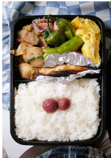
08/07/23/wed 鶏唐揚げ/シトウ・魚肉ソーセージ炒め/玉子焼/小梅 サバみりん干し