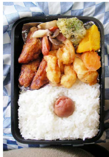
09/02/24/tue ピリ辛チキン/ウインナー・しめじ・ブロッコリー揚げ エビ天/カボチャ・大根煮/梅干し