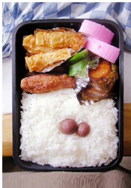
09/02/26/thu ちくわ煮/ピリ辛チキン/かまぼこ/サバみりん干し キュウリ/小梅