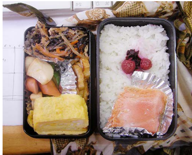
10/07/06/tue 玉子焼/塩ジャケ/ヒジキのつくだ煮/ちくわ/小梅 ダイコン・ニンジン・キュウリ・高野豆腐煮