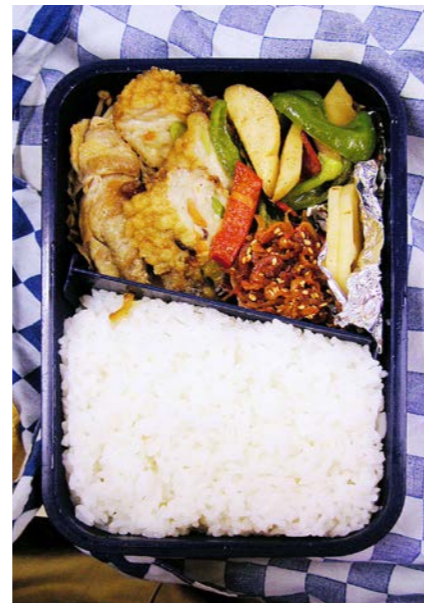
06/0/12/tue エノキの豚バラ巻/天ぷら/ピーマン・エリンギ炒め ジャコにつくだ煮