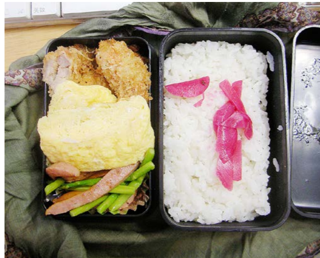
10/08/11/wed トンカツ／玉子焼／ウインナー・アスパラ炒め／紅ショウガ