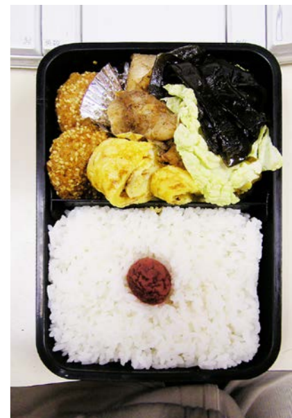
07/08/06/mon コロッケ/鶏唐揚げ/玉子焼/葉キャベツ/昆布のつくだ煮 梅干し

8月8日(水)にデジカメが故障(8月7日はカメラ忘れて未撮影)、買い換えもせず修理にも出さず、しばらく記録しなくなる。修理に出したのは翌08年2月。戻ってきたのは08年3月だった。