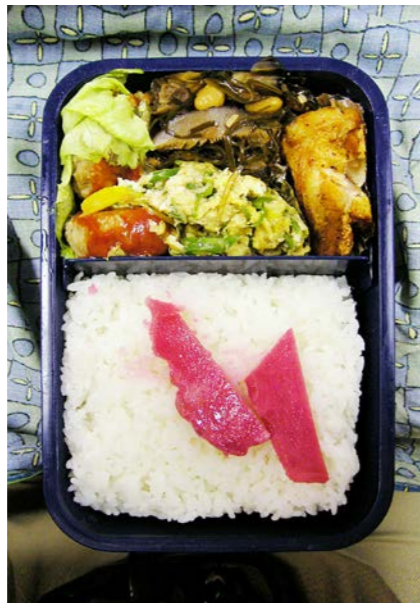
06/11/27/mon ハンバーグ/炒り卵/シイタケ・大豆・昆布のつくだ煮 シャケの唐揚げ/紅ショウガ/レタス