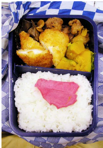
06/10/12/thu 鶏レバー/イカフライ/鶏唐揚げ/カボチャ煮/紅ショウガ