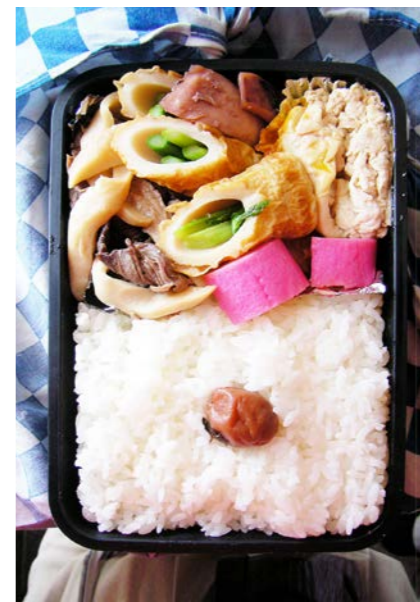
09/04/22/wed 牛・エリンギ・イカ・卵煮/ちくわ・アスパラ/かまぼこ 梅干し