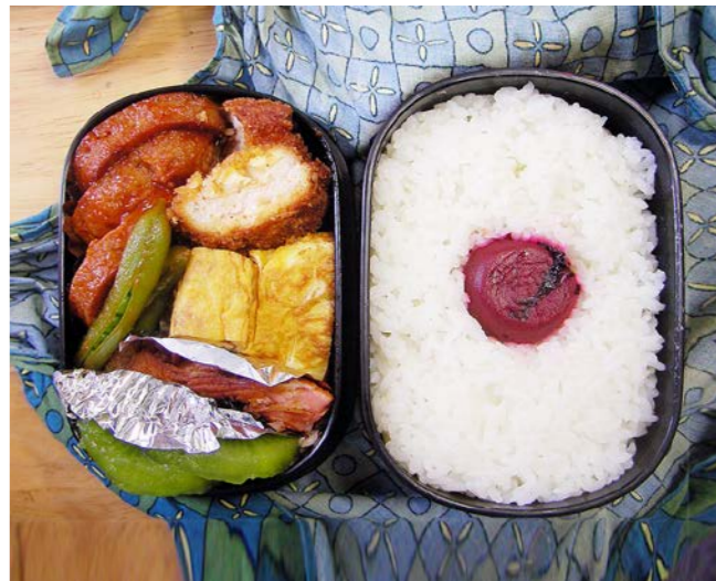
10/05/12/wed 魚肉ハンバーグ／白身魚フライ／玉子焼／塩ジャケ／キウイ サヤエンドウ煮／梅干し