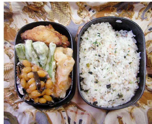
10/11/26/fri 鶏唐揚げ/アスパラ・チクワ天/大豆・昆布のつくだ煮 わかめごはん