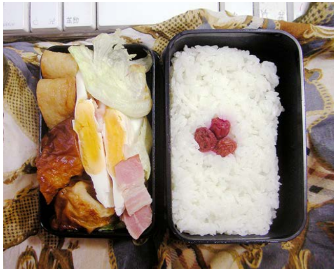
10/06/29/tue 丸天/ベーコンエッグ/ちくわ/レタス/小梅