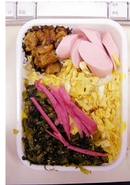
07/01/25/thu 焼き鳥/魚肉ソーセージ/高菜ご飯/錦糸玉子/紅ショウガ