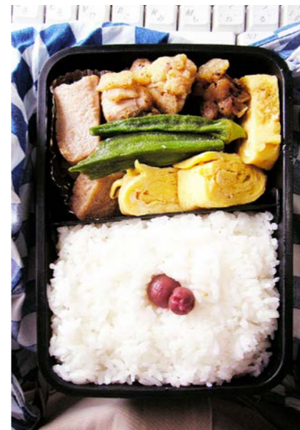
08/09/02/tue 鶏唐揚げ/すり身揚げ/オクラ/玉子焼/小梅