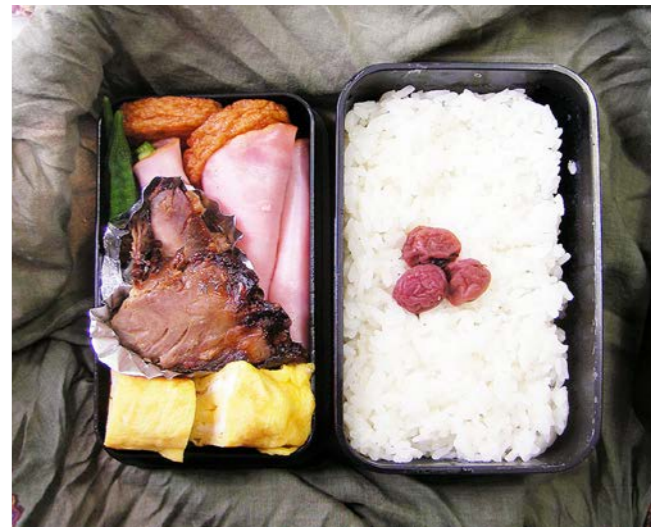
10/08/09/mon 玉子焼／焼き豚／アスパラのハム巻／野菜天／オクラ煮 小梅