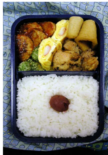
06/11/13/mon ハンバーグ/玉子焼/鶏唐揚げ/丸天/梅干し カリフラワーの天ぷら