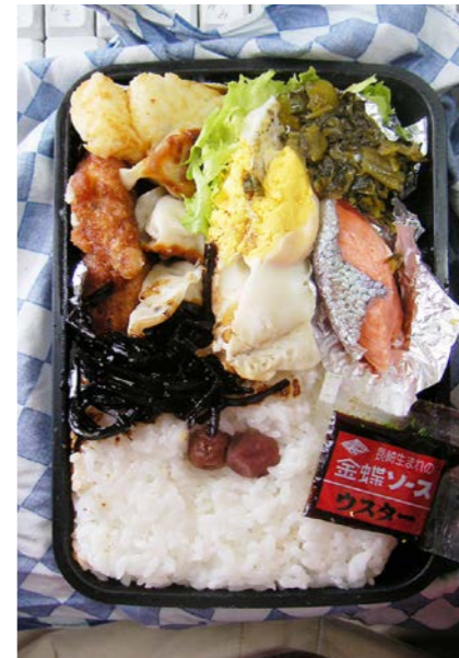
09/03/03/tue ポテトフライ/ピリ辛チキン/餃子/目玉焼/塩ジャケ/小梅 高菜炒め/レタス

平日に関わらず11時に起きて自宅弁当開き、昼出勤して いる。前日深夜残業したわけでもナシ…… 単なる寝坊？ 怠け癖？