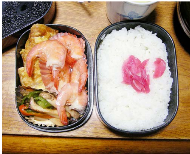
10/12/29/wed 玉子焼／エビ煮／シメジ・ピーマン炒め／紅ショウガ

前日が仕事納めなのに弁当がある。間違えて作ってもらったのだろうか？(会社にもちょっと寄ってはいるが)