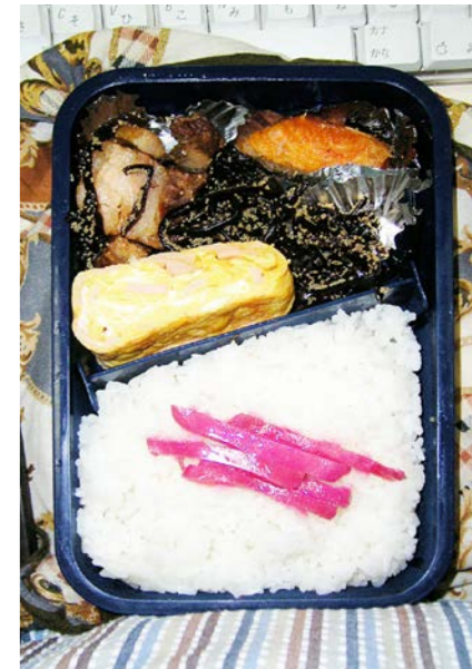
06/09/06/wed 鶏唐揚げ/玉子焼/焼シャケ/明太昆布/紅ショウガ