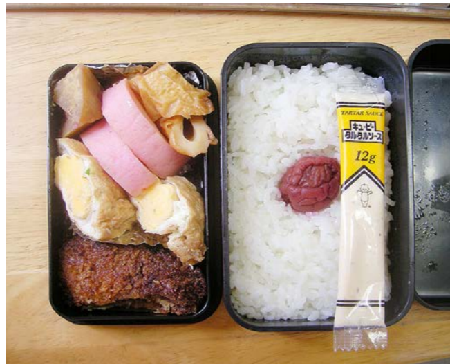
10/07/07/wed ミンチカツ/卵のさんちやく/カマボコ/ちくわ/梅干し サツマイモ煮