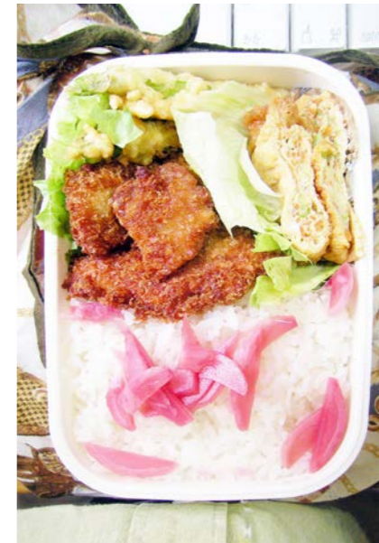
09/09/30/wed トンカツ/アスパラ天?/卵の厚揚げ煮/キャベツ 紅ショウガ