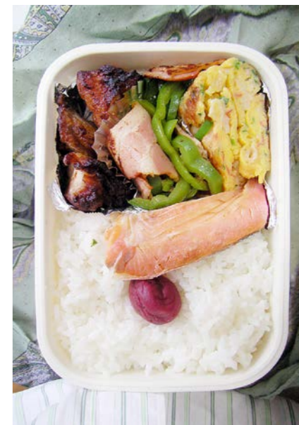
09/06/29/mon 鶏唐揚げ／ベーコン・ピーマン炒め／玉子焼／塩ジャケ 梅干し