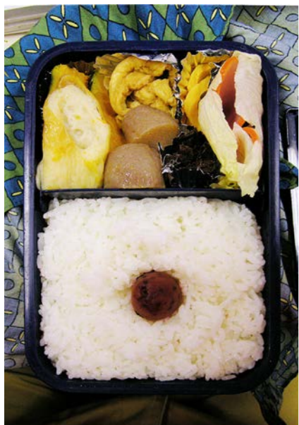
06/11/17/fri ちくわ/こんにゃく・油揚げ煮/ロースハム/たくあん 塩鯨?/梅干し/レタス