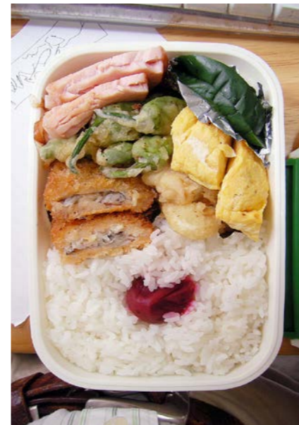
09/08/10/mon 白身魚フライ／シシトウ・レンコンの天ぷら／ハム／玉子焼 キュウリ／梅干し