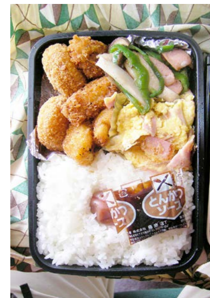
09/04/01/wed コロッケ/メンチカツ/ピーマン・魚肉ソーセージ炒め 炒り卵/梅干し