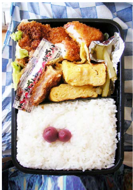
08/07/08/tue トンカツ/玉子焼/ふき煮/レタス/小梅