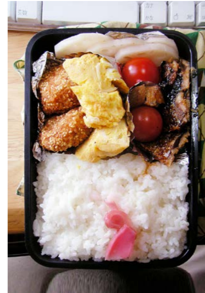
08/11/26/wed コロッケ/れんこんの酢物/目玉焼/イワシのみりん干し ミニトマト/紅ショウガ