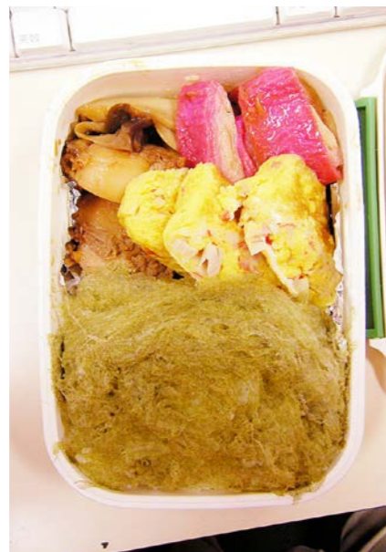
07/02/02/fri 肉じゃが/エリンギ・かまぼこ炒め/玉子焼/とろろ昆布