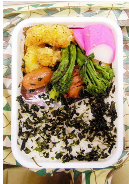
07/04/16/mon エビフライ/ウインナー・カリフラワー炒め/かまぼこ わかめごはん