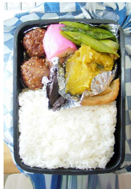
09/04/23/thu 肉団子/かまぼこ/アスパラ・かぼちゃ・天ぷら煮