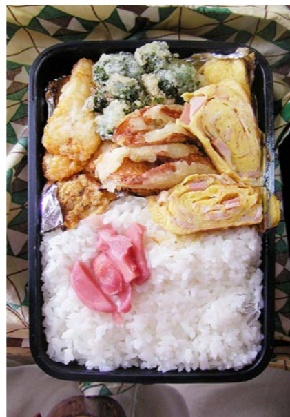
09/02/16/mon ポテトフライ/すり身・ウィンナー・ブロッコリーの天ぷら 玉子焼/紅ショウガ