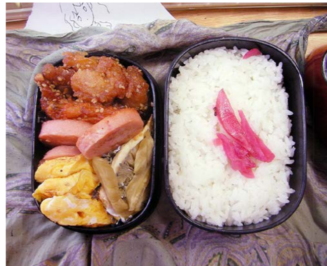
10/12/27/mon 鶏南蛮／魚肉ハム／玉子焼／奈良漬／紅ショウガ