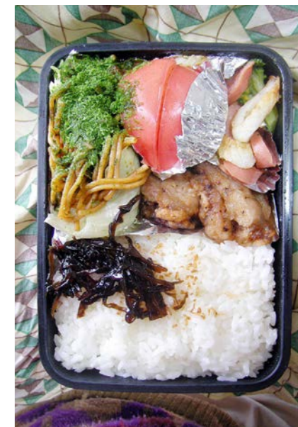
09/02/19/thu 焼きそば/鶏唐揚げ/レタス/昆布のつくだ煮 魚肉ソーセージ・ちくわ・ブロッコリー炒め