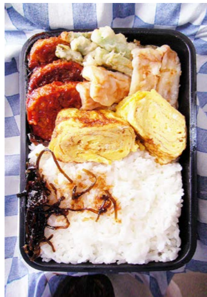
09/04/24/fri ハンバーグ/ちくわ・アスパラ天/昆布のつくだ煮/玉子焼