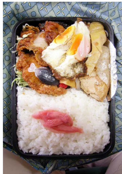
08/11/21/fri トンカツ/目玉焼/揚げ豆腐・筍煮/キャベツ/紅ショウガ