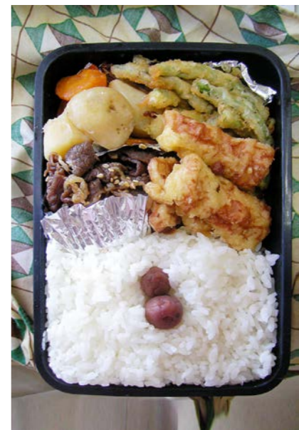
08/11/18/tue 牛煮/ジャガイモ・ニンジン煮/インゲン豆・ちくわの天ぷら 小梅