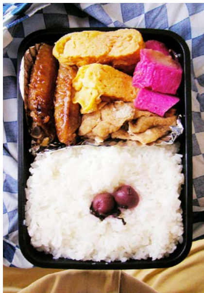
08/07/29/tue 手羽揚げ/玉子焼/かまぼこ/油揚げ煮/小梅