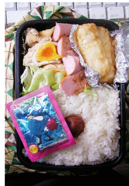
09/02/20/fri ポテトフライ/卵のきんちゃく/魚肉ソーセージ/レタス 梅干し/ふりかけ