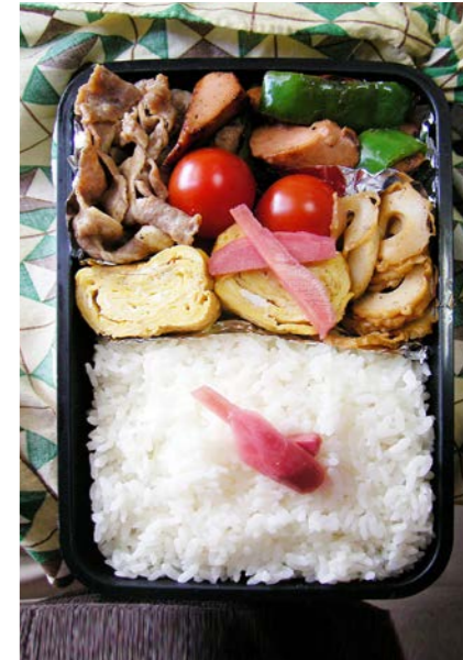
08/11/25/tue 豚炒め/魚肉ソーセージ・ピーマン炒め/玉子焼/焼ちくわ ミニトマト/紅ショウガ