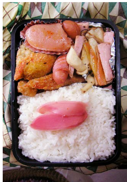
09/01/13/tue カニかまフライ/ウインナー/明太子/紅ショウガ 魚肉ソーセージ・エリンギ・ニンジン炒め