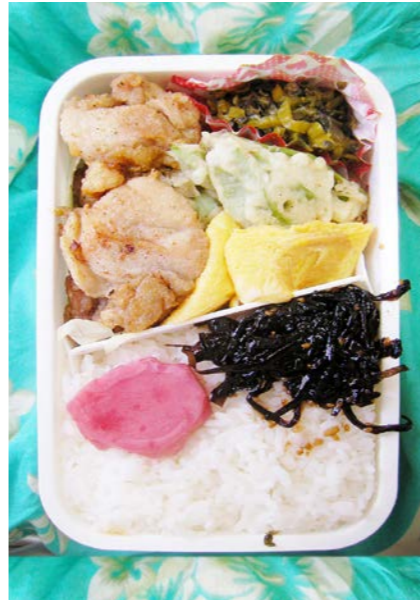
09/10/21/wed 鶏唐揚げ/玉子焼/サヤエンドウの天ぷら?/高菜炒め 昆布のつくだ煮/紅ショウガ