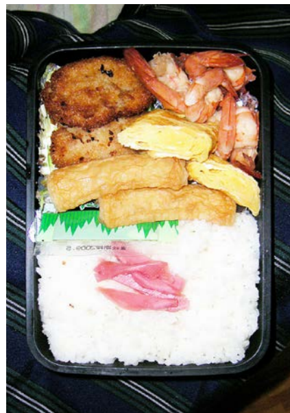
08/11/24/mon コロッケ/エビ・ちくわ煮/玉子焼/キャベツ/紅ショウガ