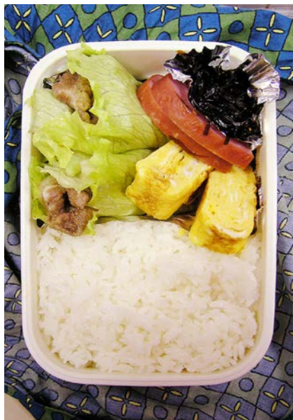
06/12/27/wed 鶏唐揚げ/玉子焼/焼き豚/昆布のつくだ煮/レタス