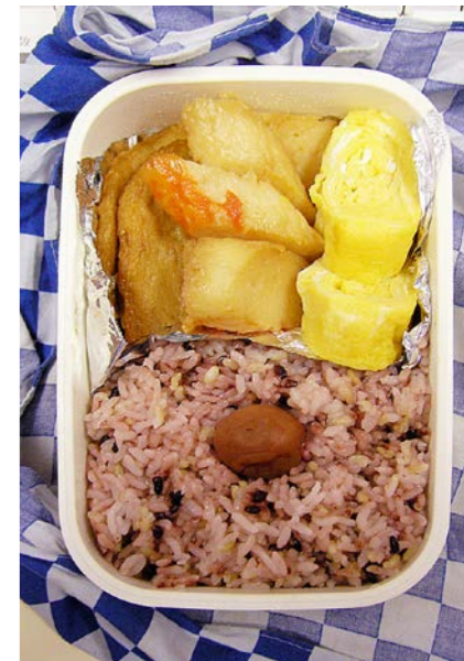
07/03/12/mon 天ぷら・かまぼこ煮/玉子焼/赤米/梅干し