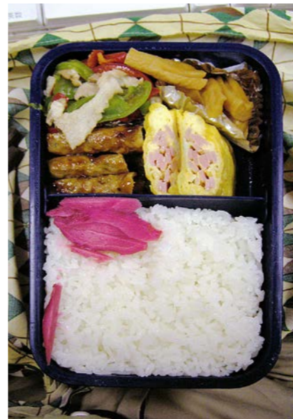
06/11/01/wed 豚・ピーマン炒め/玉子焼/つくね?/かんぴょうの漬物 紅ショウガ