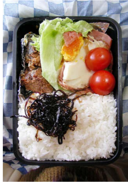
08/11/28/fri サバの缶詰?/ベーコンエッグ/ミニトマト/昆布のつくだ煮 レタス