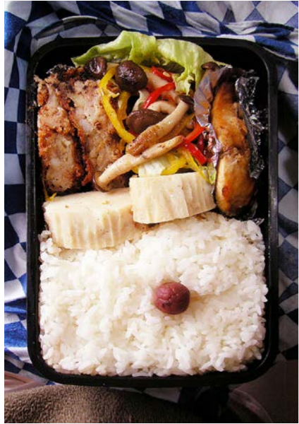
08/12/03/wed コロッケ/シメジ・ピーマン炒め/すぼかまぼこ/レタス サバみりん干し/小梅