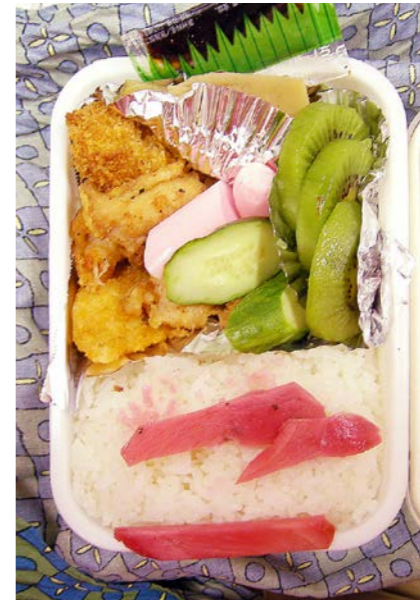
07/04/04/wed カニカマフライ/なんかのフライ/白身魚フライ/箱煮 ソーセージ・キュウリ炒め/キウイ/紅ショウガ