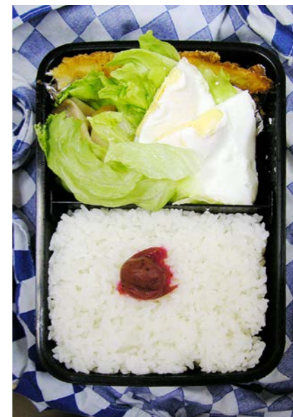
07/07/10/tue 白身魚フライ／シイタケ煮／目玉焼／レタス／梅干し