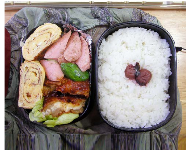
10/12/24/fri 玉子焼／鶏南蛮／ソーセージ・キュウリ炒め／レタス／小梅