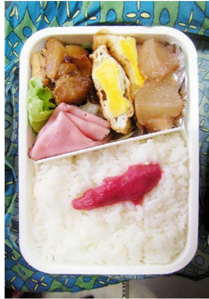
09/12/25/fri 鶏照焼/卵の厚揚げ煮/ダイコン煮/ロースハム/レタス 紅ショウガ