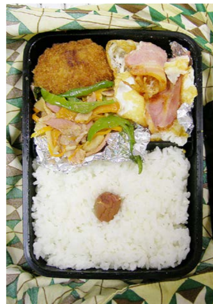
07/07/05/thu 一口トンカツ?/ベーコンエッグ/野菜炒め/梅干し