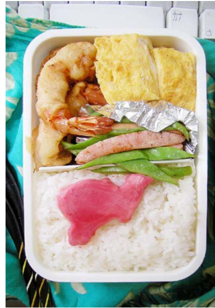
09/10/19/mon エビ天/玉子焼/ウインナー・サヤエンドウ炒め 紅ショウガ