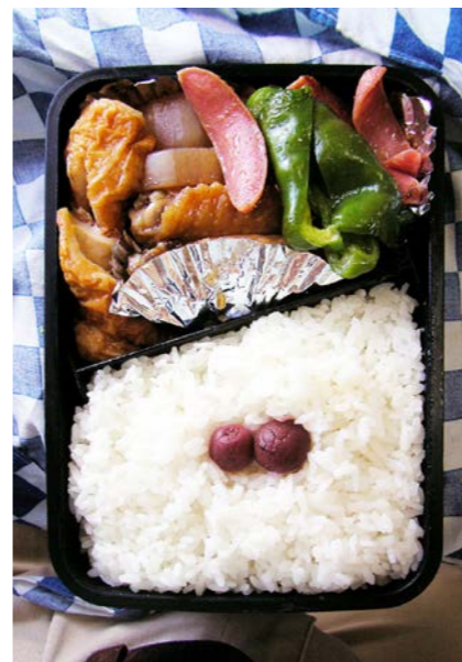
08/09/03/wed ちくわ・レンコン・手羽元煮/ピーマン・ウインナー炒め 小梅