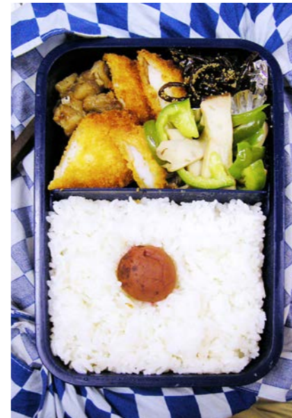
06/09/08/fri 焼き鳥/イカフライ/ピーマン・エリンギ炒め/明太昆布 梅干し