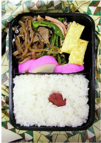
07/08/03/fri 牛・こんにゃく煮/ハム・ピーマン炒め/玉子焼/かまぼこ梅干し