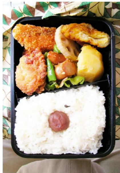
08/07/14/mon 白身魚フライ／鶏唐揚げ／ピーマン・ウィンナー炒め ちくわと根菜煮／梅干し