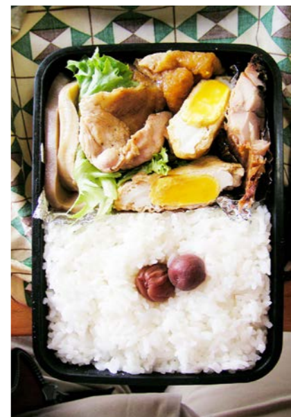
09/04/02/thu 筍煮/きんちゃく卵/鶏南蛮/塩ジャケ/レタス/小梅