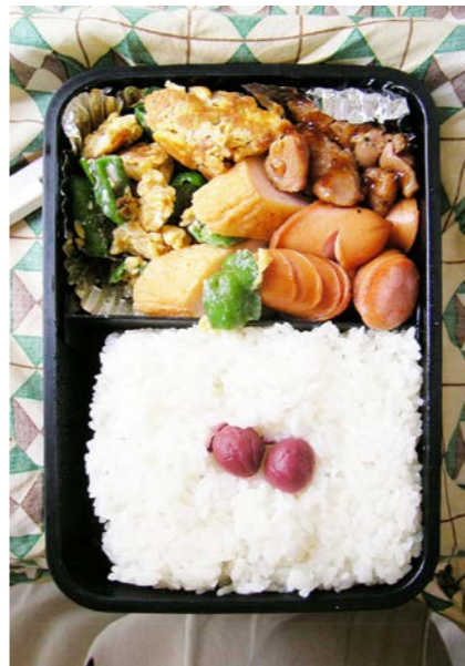
08/07/01/tue ピーマンの炒り卵/焼き鳥/ウインナー/かまぼこ/小梅