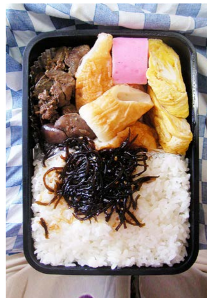
09/01/28/wed 鶏レバー/ちくわ/かまぼこ/玉子焼/昆布のつくだ煮