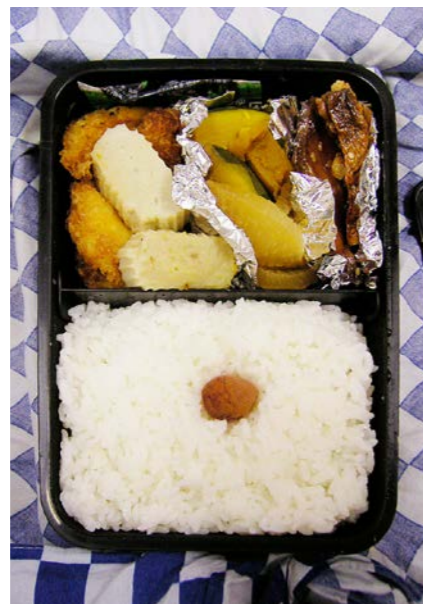
07/07/17/tue 判別不能フライ／すぼかまぼこ／かぼちゃ・大根・丸天煮 魚のつくだ煮／梅干し