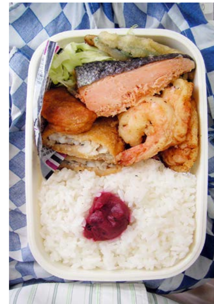
09/08/06/thu 白身魚フライ／塩ジャケ／エビ・インゲン豆の天ぷら／梅干し キャベツ