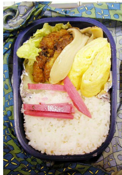
06/12/20/wed 天ぷら・エリンギ煮/玉子焼/紅ショウガ/レタス