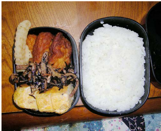
11/02/02/wed 玉子焼／チキナゲット／フライドポテト／ヒジキ和え