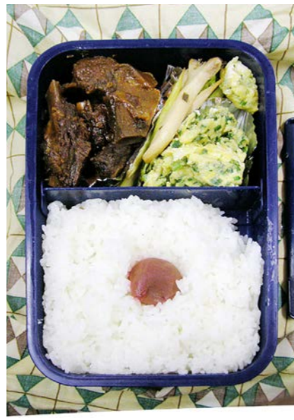
06/08/02/wed 猪の煮物/アスパラ/炒り卵/梅干し