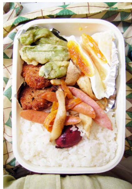
09/07/03/fri シントウの天ぷら／ささみフライ？／目玉焼／梅干し エリンギ・ピーマン・ニンジン炒め