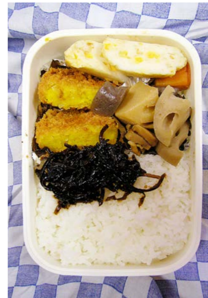
07/03/19/mon かぼちゃコロッケ/筑前煮/コーン天ぷら/昆布のつくだ煮