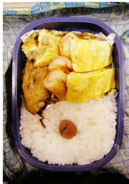
06/12/25/mon オムレツ/鶏唐揚げ/ちくわ(カニかまぼこ刺し)/玉子焼 梅干し

ソースじゃなくさしみしょうゆなのも一般家庭の弁当ならではの。買い置きなどしてないので前日の刺身パックについての奴が入っていたりする。