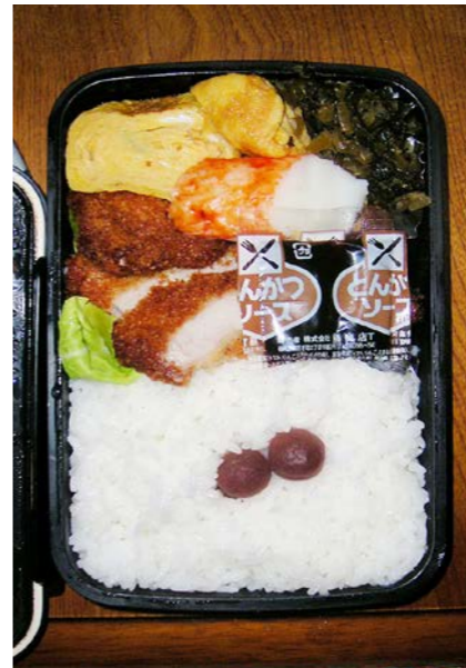
09/03/05/thu トンカツ/カマボコ/玉子焼/高菜炒め/小梅/キャベツ

平日に関わらず11時に起きて自宅弁当開き、昼出勤して いる。前日深夜残業したわけでもナシ…… 単なる寝坊？ 怠け癖？