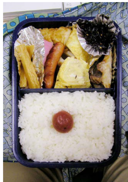
06/11/06/mon ちくわ/ウインナー/かまぼこ/玉子焼/魚のみりん干し 昆布のつくだ煮/梅干し