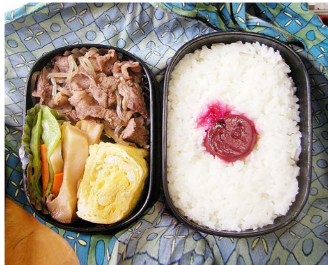
10/05/11/tue 牛・こんにゃく煮／エリンギ・ニンジン・サヤエンドウ煮 玉子焼／梅干し