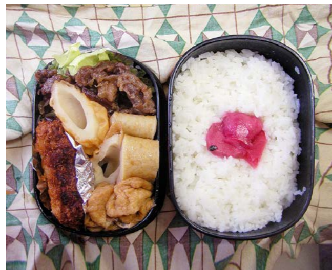
10/11/29/mon 牛煮/チクワ・丸天・油揚げ煮/串カツ?/レタス 紅ショウガ