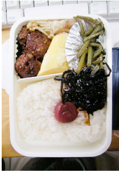
09/10/26/mon 肉団子/エノキの豚バラ巻/玉子焼/芋づる煮/梅干し 昆布のつくだ煮