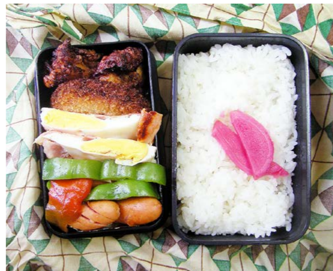
10/08/30/mon ベーコンエッグ/コロッケ/鶏唐揚げ/紅ショウガ ウインナー・ピーマン炒め