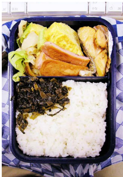
06/08/28/mon 焼ジャケ/玉子焼/天ぶら/ちくわ炒め/高菜炒め/レタス

天ぶらの単体表記は九州以外でさつま揚げとかすり身揚げと呼ばれるもの(丸いのは丸天と呼称)。