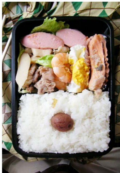
08/07/15/tue 魚肉ソーセージ／エビ・牛・エリンギ煮／目玉焼／塩ジャケ レタス／梅干し