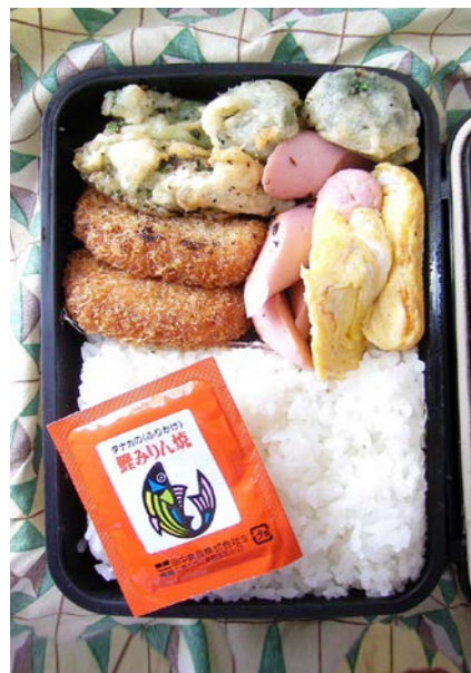
09/04/08/wed コロッケ/ブロッコリーの天ぷら/魚肉ソーセージ/玉子焼 ふりかけ