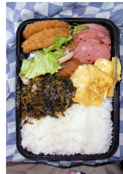
09/02/10/tue コロッケ/鶏南蛮/魚肉ソーセージ/玉子焼/高菜炒め レタス