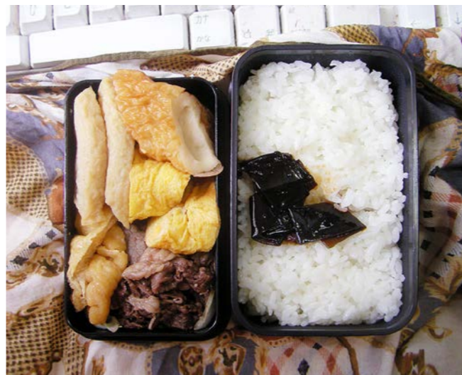
10/06/22/tue 牛つくだ煮/玉子焼/丸天/油揚げ煮/昆布のつくだ煮 ちくわ