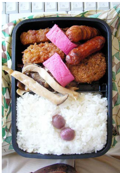
08/09/08/mon コロッケ/ウインナー/かまぼこ/エリンギ・シイタケ炒め 小梅