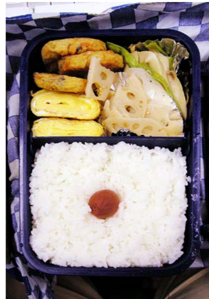
06/09/11/mon 天ぷら/玉子焼/レンコンのきんぴら/エリンギ・長豆炒め 梅干し