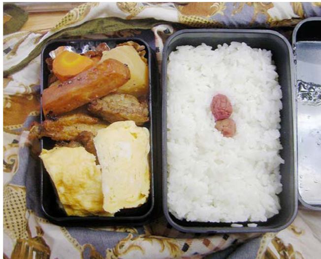
10/06/28/mon 肉じゃが/鶏唐揚げ/玉子焼/大学芋/小梅