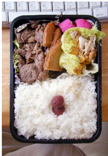
08/07/28/mon 牛・丸天煮/豚こまの炒り卵/かまぼこ/小梅/レタス