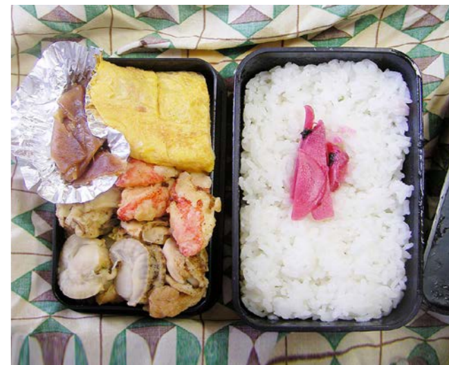
10/08/28/sat 玉子焼/ショウガのつくだに/カニかまフライ/謎の天ぷら ホタテ/紅ショウガ