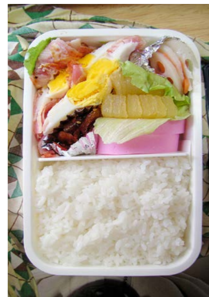
10/01/03/sun ベーコンエッグ/数の子/カマボコ/ハス・ニンジン酢の物 レタス/マグロつくだ煮?