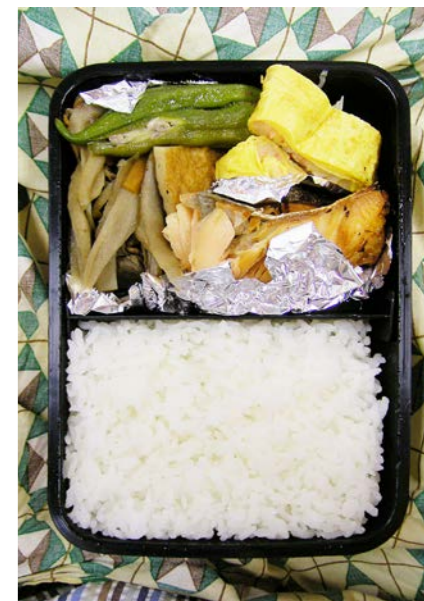
07/06/28/thu 牛きんぴら/オクラ煮/玉子焼/塩ジャケ