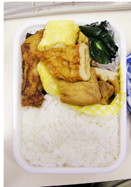
07/03/22/thu 鶏唐揚げ/玉子焼/揚げ豆腐・ちくわ煮/キュウリの浅漬