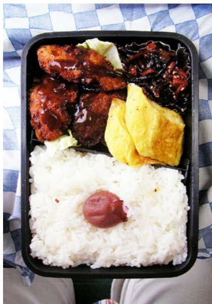
08/06/05/thu ささみフライ?/玉子焼/昆布・マグロのつくだ煮/梅干し