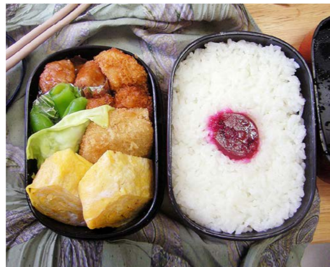
10/05/07/fri ミートボール／コロッケ／玉子焼／エビ天／サヤエンドウ 梅干し