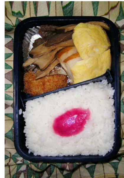
06/11/21/tue エリンギ・レバー炒め/天ぷら/玉子焼/メンチカツ 紅ショウガ

コロッケかメンチカツかは切ってみないと判らないもの。 切ってないものには食ってきた者のカンで選択している。