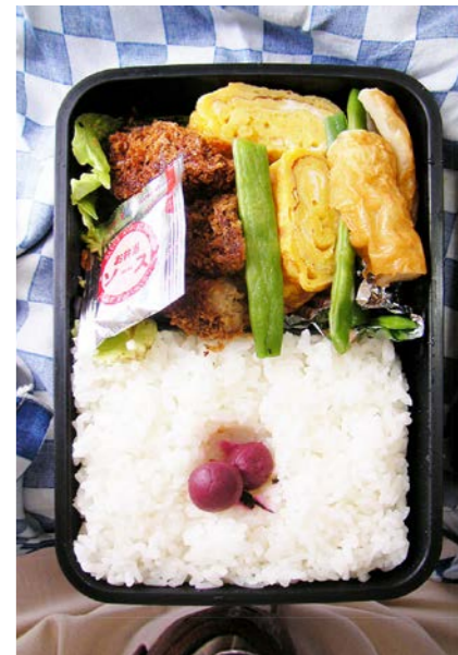
08/06/27/fri ミンチカツ/インゲン豆・ちくわ煮/玉子焼/キャベツ/小梅