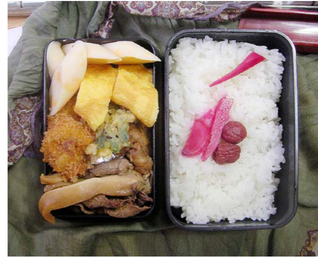
10/07/13/tue 玉子焼/チーカマ/牛・エリンギ煮/串カツ/大葉の天ぷら 紅ショウガ/小梅