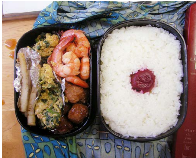
10/05/14/fri 炒り卵／エビ煮／肉団子／酢ごぼう／梅干し