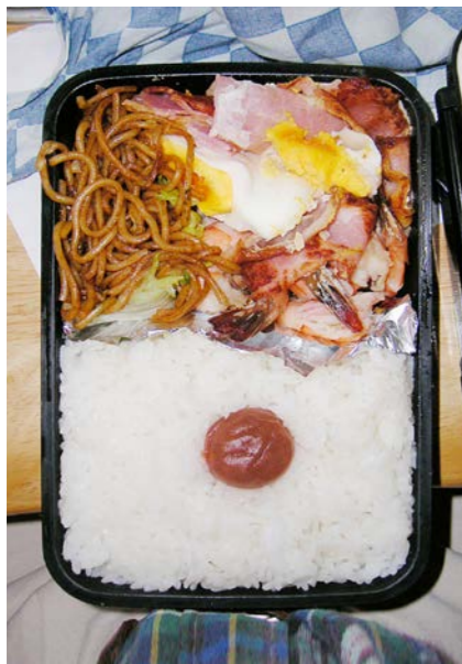
09/02/09/mon 焼きそば/ベーコンエッグ/エビ煮/レタス/梅干し