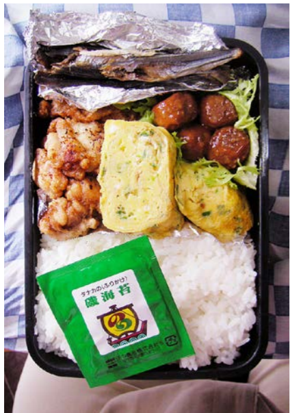
09/03/23/mon 鶏唐揚げ/アゴ干し/玉子焼/ミートボール/ふりかけ レタス