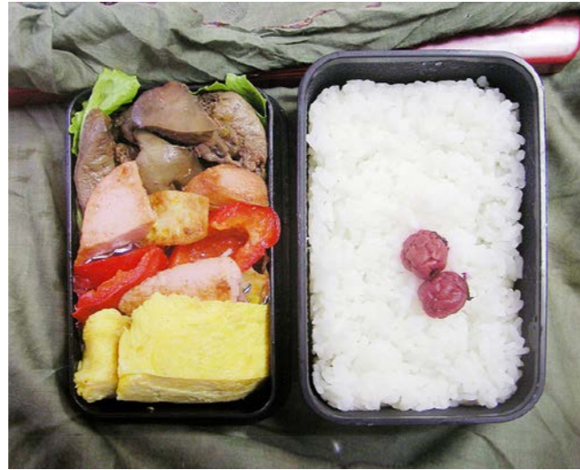
10/07/14/wed 玉子焼/鶏レバー煮/ソーセージ・パプリカ炒め/レタス 小梅