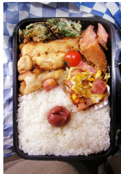
09/01/29/thu ハム・大葉の天ぷら/ハム入り炒り卵/塩ジャケ/イカ天? 梅干し