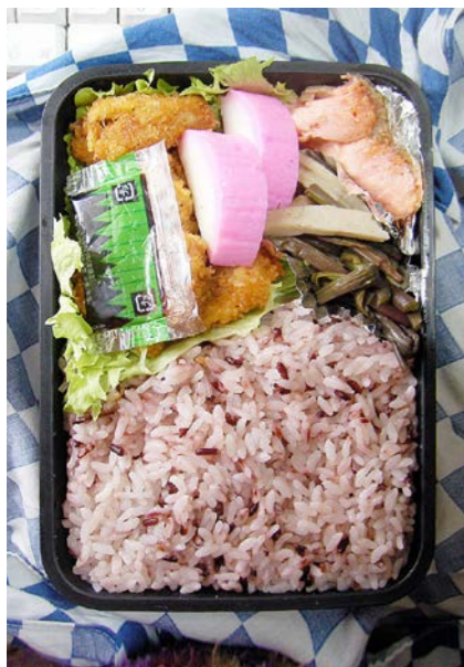
09/02/27/fri エビフライ/かまぼこ/塩ジャケ/丸天・ぜんまいのつくだ煮 レタス/赤米