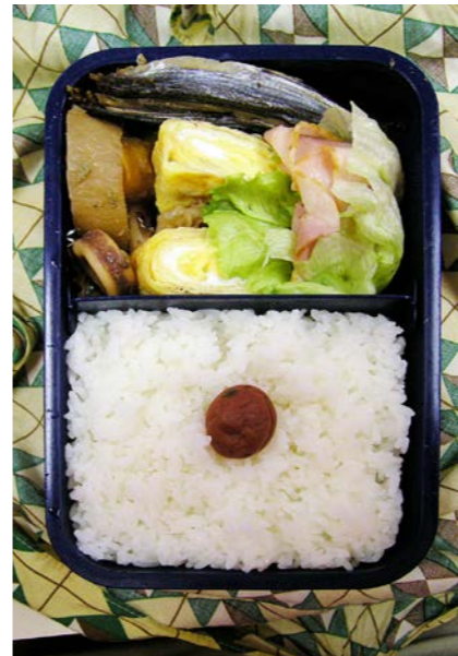
06/11/22/wed アゴの一夜干し/イカ大根/玉子焼/ベーコン/梅干し レタス