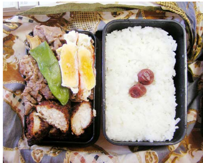
10/10/29/fri 白身魚フライ/ベーコンエッグ/豚炒め/エンドウ豆/小梅