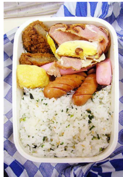
07/03/29/thu ミンチカツ/ベーコンエッグ/ソーセージ/ウインナー 玉子焼