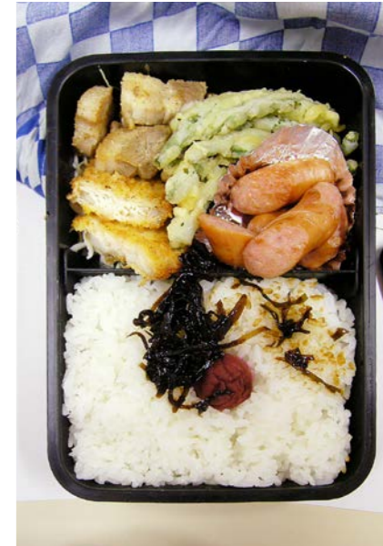
07/07/27/fri 豚バラ/自身魚フライ/インゲン豆の天ぷら/ウインナー梅干し/昆布のつくだ煮