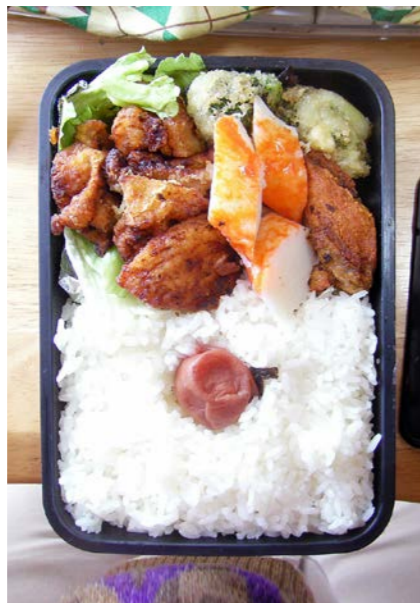
09/02/02/mon 鶏唐揚げ/ブロッコリーの天ぷら/かまぼこ/レタス ピリ辛チキン/梅干し