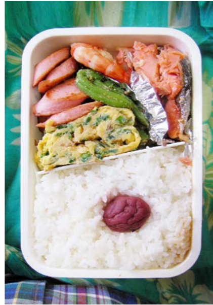
09/10/22/thu 魚肉ソーセージ/エビ/玉子焼/塩ジャケ/梅干し インゲン豆のゴマ和え