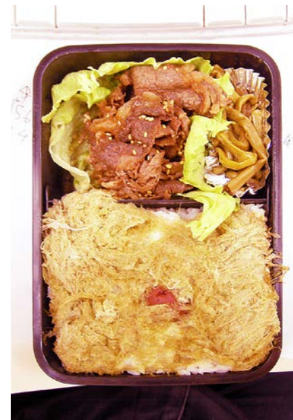
07/07/11/wed 牛炒め／レタス／芋づる煮／とろろ昆布／梅干し