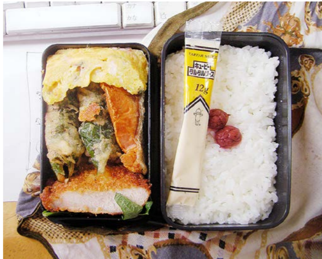
10/07/08/thu トンカツ/玉子焼/塩ジャケ/シシトウの天ぷら/小梅