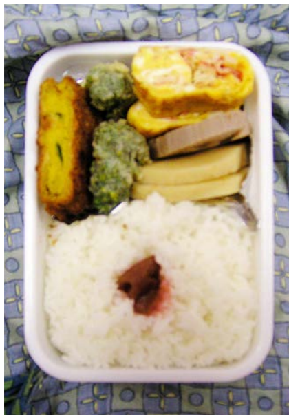
07/04/02/mon かぼちゃコロッケ/カリフラワーの天ぷら/玉子焼/梅干し 筍・れんこん煮