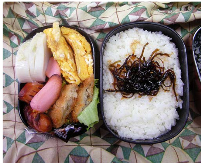
11/02/08/tue 玉子焼／白身魚フライ／ウインナー／魚肉ソーセージ カマボコ／昆布のつくだ煮