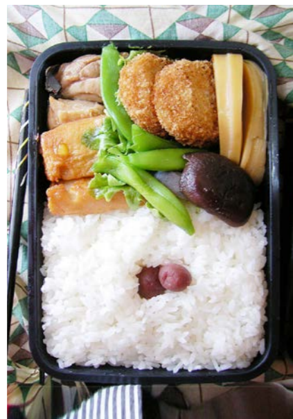
09/04/07/tue 鶏・天ぷら・筍・シイタケ・コンニャク・エンドウ豆煮/レタス コロッケ/小梅