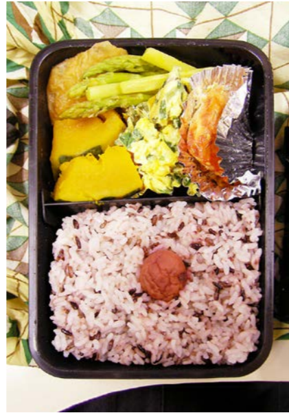
07/08/01/wed ちくわ・かぼちゃ・アスパラ煮/炒り卵/サバみりん干し梅干し/赤米