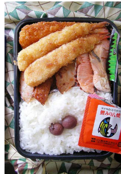
09/03/12/thu エビフライ/白身魚フライ/野菜天/塩ジャケ/ふりかけ 小梅