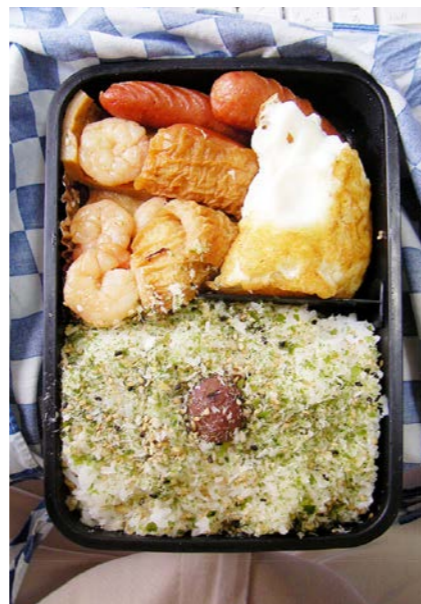
08/05/28/wed ウインナー/小エビ・丸天・ちくわ煮/玉子焼/ふりかけ 梅干し