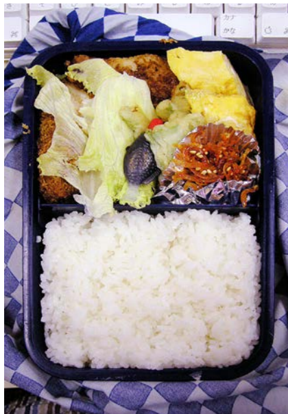
06/09/14/thu 自身魚フライ/長豆・ピーマンの天ぷら/玉子焼/レタス ジャコにつくだ煮