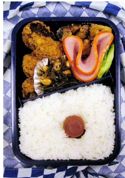
06/09/15/fri ひとくちカツ/やきとり/ロースハム/大豆・昆布のつくだ煮 梅干し/キュウリ