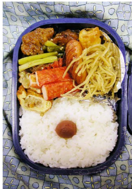
06/12/22/fri 鶏レバー南蛮/オムレツ/カニかまぼこ/ウインナー/春巻 きんぴらごぼう/梅干し