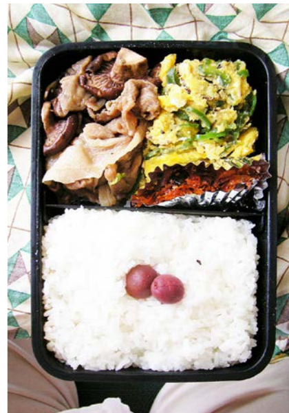
08/07/17/thu 豚・シイタケ煮/炒り卵/昆布・かつお節のつくだ煮/小梅