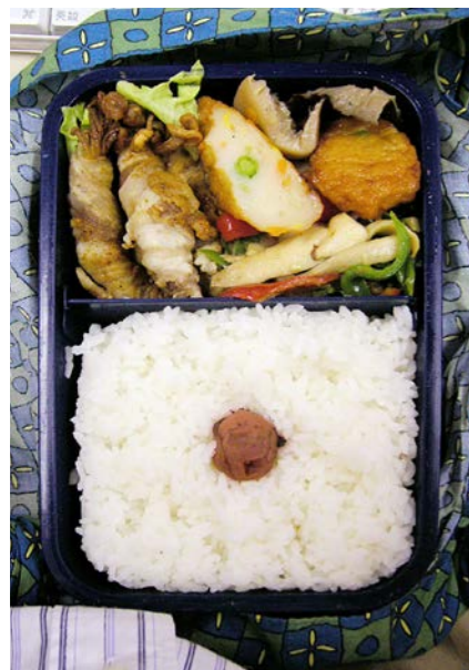
06/11/08/wed エノキの豚バラ巻/しいたけ・天ぷら煮/梅干し/レタス エリンギ・ピーマン炒め