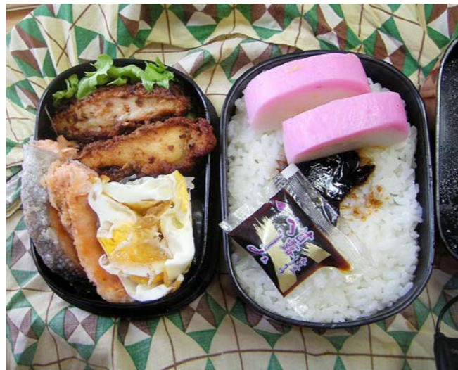
11/02/09/wed トンカツ／目玉焼／塩ジャケ／カマボコ／昆布のつくだ煮 レタス