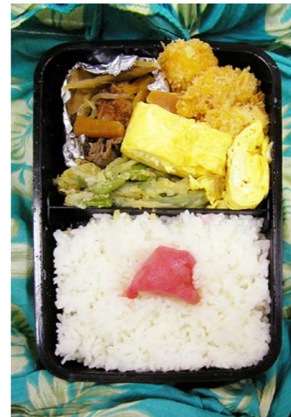
07/06/29/fri 牛きんぴら/インゲン豆の天ぷら/玉子焼/小エビフライ 紅ショウガ