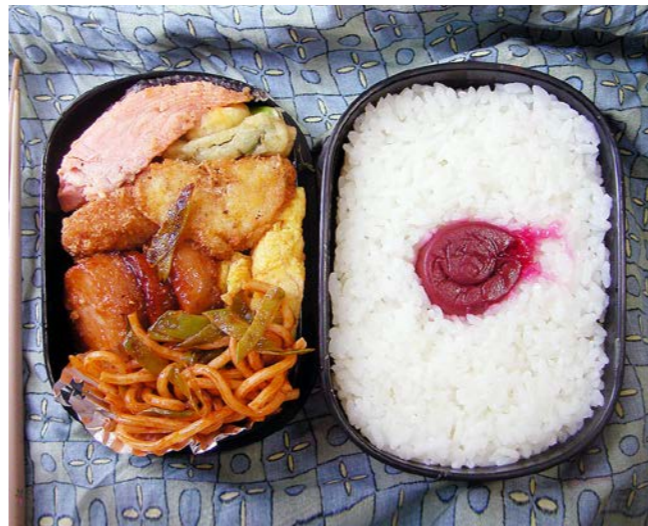
10/05/13/thu 塩ジャケ／魚肉ソーセージ／玉子焼／コロッケ／アスパラ天？ スパゲティ／梅干し