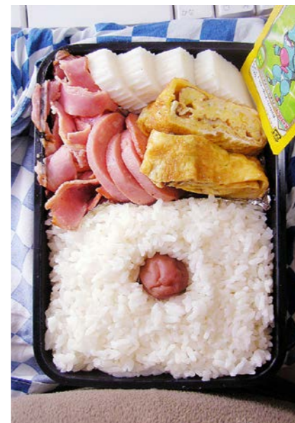
09/02/12/thu ベーコン/魚肉ソーセージ/すばかまぼこ/玉子焼/梅干し ふりかけ