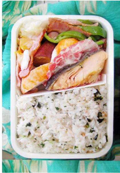
09/10/23/fri ベーコンエッグ/サツマイモ/カマボコ/塩ジャケ ベーコン・ピーマン炒め/わかめご飯