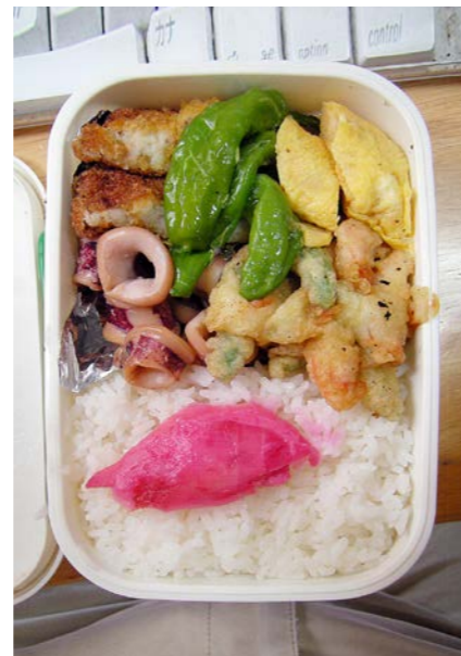
09/08/11/tue コロッケ／イカ煮／シシトウ揚げ／エビのかき揚げ／玉子焼 紅ショウガ