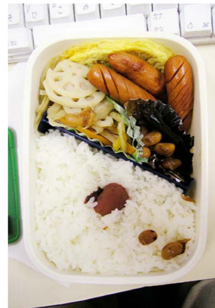
07/01/18/thu ゴボウ・レンコン炒め／玉子焼／梅干し ウインナー大豆・昆布のつくだ煮