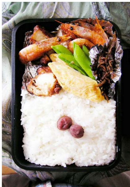
09/04/28/tue 天ぷら/海老から揚げ/エンドウ豆/玉子焼/小梅 ジャコのつくだ煮