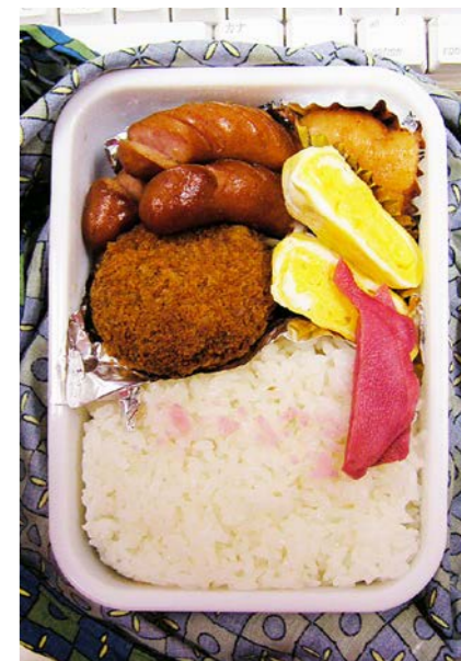
07/01/16/tue ウインナー／ミンチカツ／玉子焼／明太子／紅ショウガ