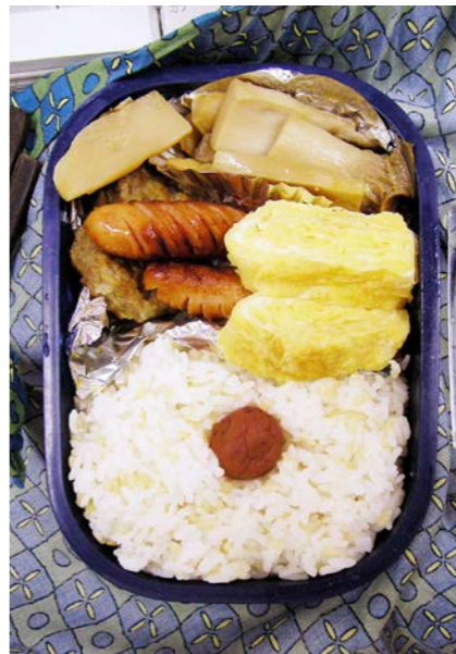
06/12/21/thu ハンバーグ/エリンギ煮/ウインナー/玉子焼/梅干し