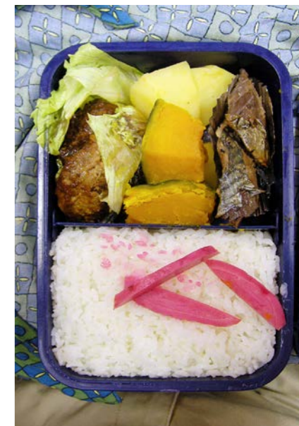
06/11/09/thu ハンバーグ/ジャガイモ・カボチャ煮/サバ煮/紅ショウガ レタス