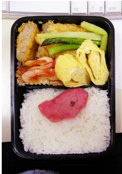
07/04/18/wed メンチカツ/エビ・ちくわ・アスパラ煮/玉子焼/紅ショウガ