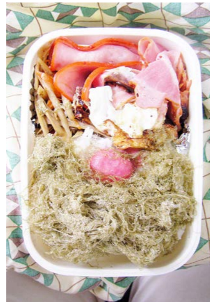
09/10/05/mon きんぴらごぼう/ロースハム/ベーコンエッグ/とろろ昆布 紅ショウガ