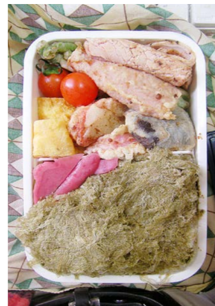
10/01/04/mon 魚肉ソーセージ・カニかま・シタケ・インゲン豆の天ぷら 玉子焼/とろろ昆布/紅ショウガ/ミニトマト