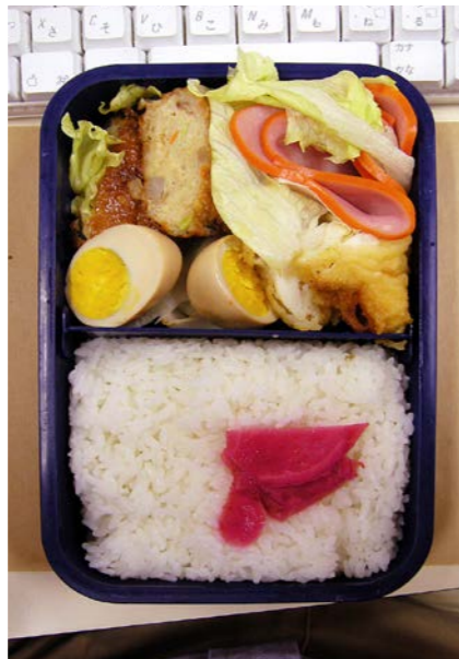
06/11/15/wed 天ぷら/煮卵/イカフライ/ロースハム/紅ショウガ/レタス