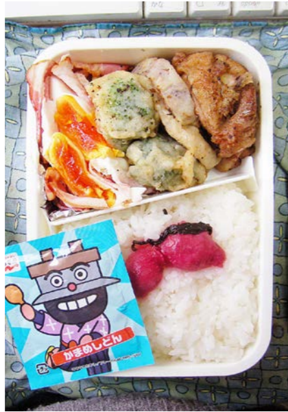
09/12/28/mon ベーコンエッグ/鶏唐揚げ/レンコン・ブロッコリーの天ぷら ふりかけ/紅ショウガ