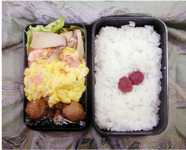
10/07/15/thu 炒り卵/肉団子/エリンギ・エビ煮/レタス/小梅