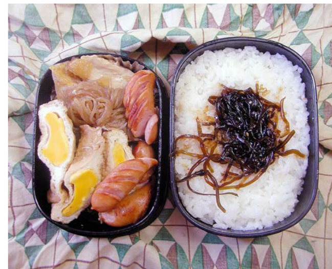
11/01/28/fri 卵のきんちゃく／ウインナー／鶏・コンニャク煮 昆布のつくだ煮