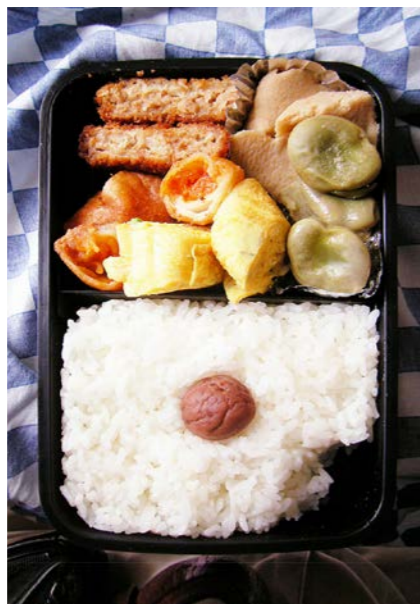
08/06/04/wed ミンチカツ/玉子焼/高野豆腐・空豆煮/ピリ辛春巻? 梅干し