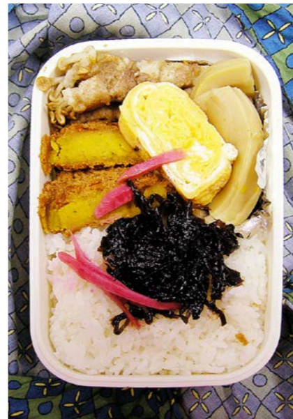
07/01/30/tue エノキの豚バラ巻/かぼちゃコロッケ/玉子焼/筍煮 昆布のつくだ煮/紅ショウガ