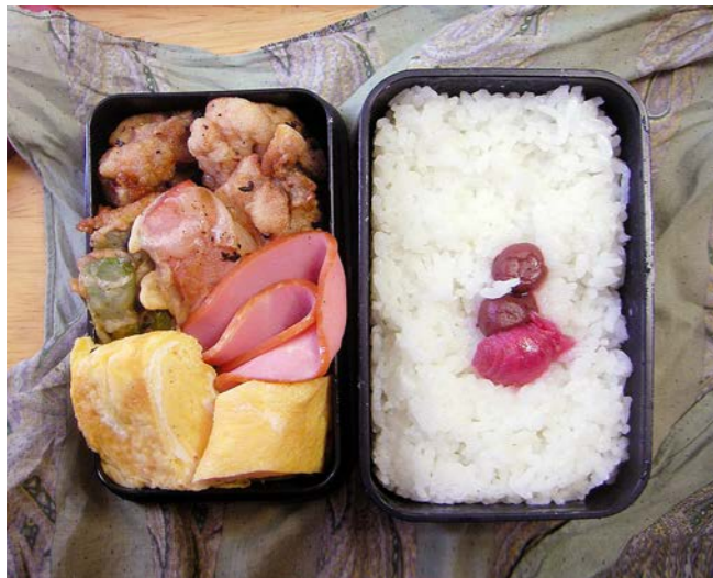
10/11/01/mon 鶏唐揚げ/エンドウ豆・ハムの天ぷら/玉子焼/ロースハム 紅ショウガ/小梅