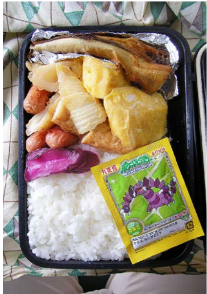
09/03/10/tue 塩ジャケ/ウインナー/ちくわ・筍煮/玉子焼/キュウリ漬け ふりかけ