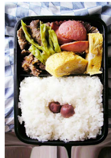
08/09/01/mon 牛・インゲン豆煮/玉子焼/ウインナー/小梅