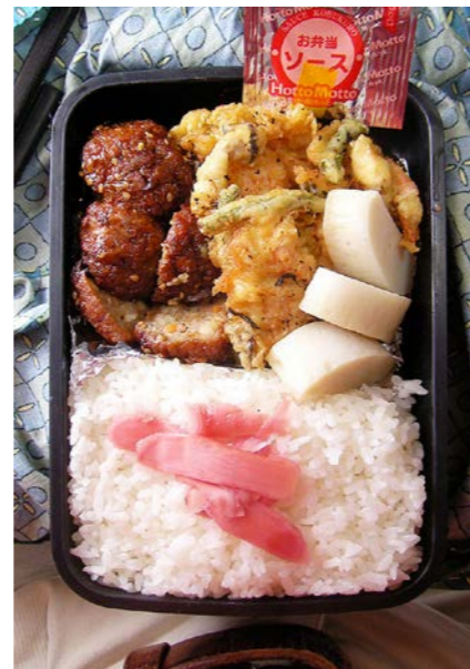
08/11/20/thu 肉団子/エビ・野菜天ぷら/かまぼこ/紅ショウガ