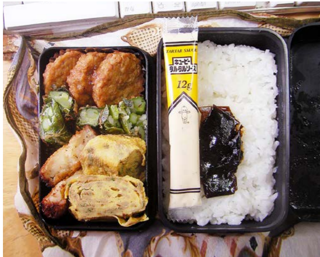
10/07/09/fri ハンバーグ/玉子焼/コロケ/アスパラのしそ巻き揚げ 昆布のつくだ煮