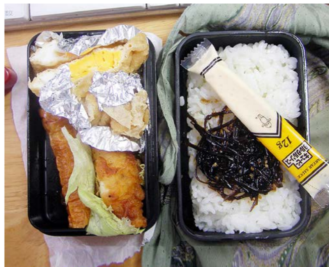
10/06/21/mon 卵のきんちゃく/油揚げ煮/ちくわ/鶏南蛮/レタス 昆布のつくだ煮