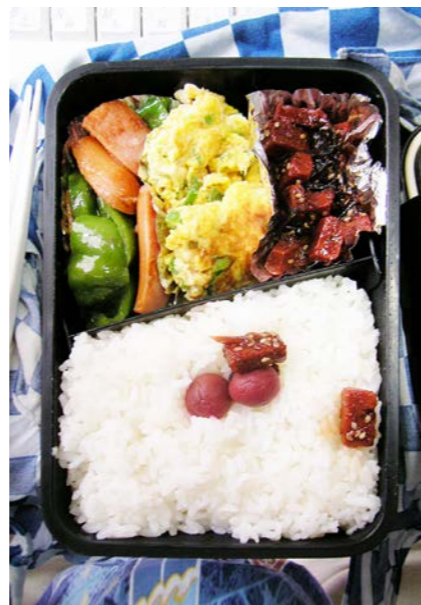
08/07/04/fri ピーマン・ウインナー炒め/炒り卵/昆布・マグロつくだ煮 小梅