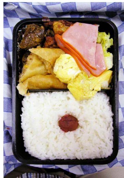
07/07/12/thu 鶏レバー／春巻／玉子焼／プレスハム／鶏唐揚げ／レタス 梅干し