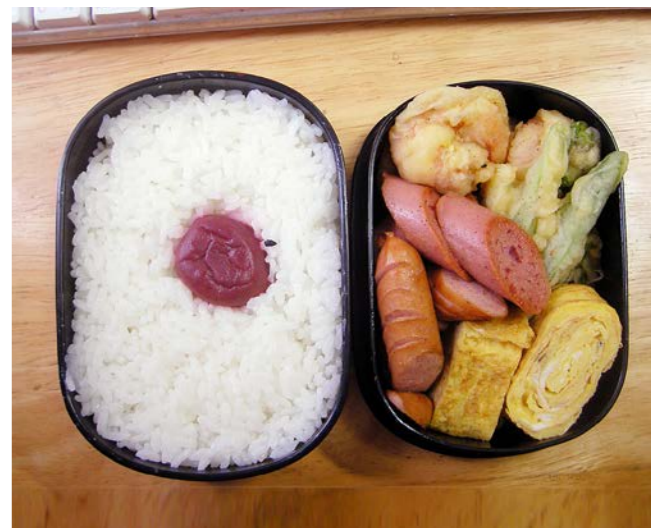
10/05/06/thu ウインナー・魚肉ソーセージ炒め／玉子焼／エビ天 アスパラ・ブロッコリー天／梅干し