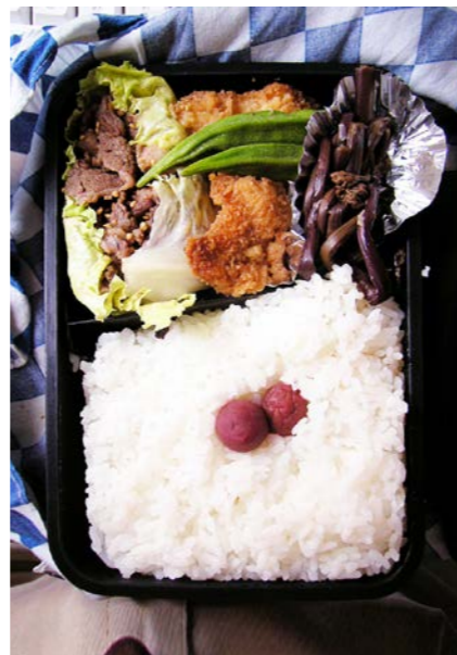
08/07/24/thu 牛きんぴら/オクラ/魚の唐揚げ/ぜんまいのつくだ煮 小梅/レタス