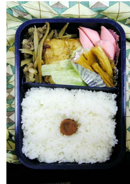
06/11/20/mon 牛肉・ごぼう煮/シャケの唐揚げ/魚肉ソーセージ/梅干し かんぴょうの漬物/レタス

コロッケかメンチカツかは切ってみないと判らないもの。 切ってないものには食ってきた者のカンで選択している。