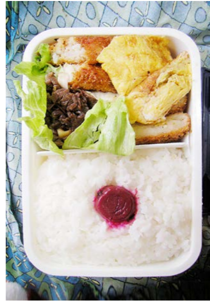
09/12/24/thu 牛煮/白身魚フライ/玉子焼/コロッケ/レタス/梅干し