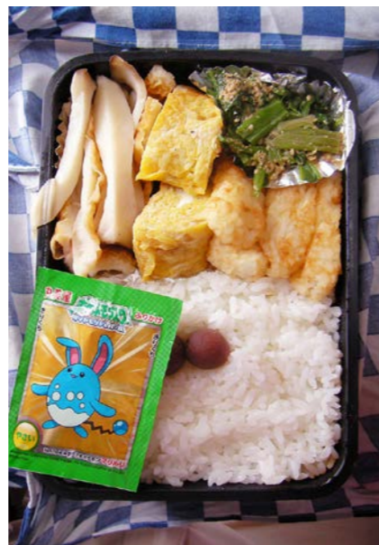
09/02/25/wed ちくわ/玉子焼/ポテトフライ/ほうれん草のゴマ和え ふりかけ