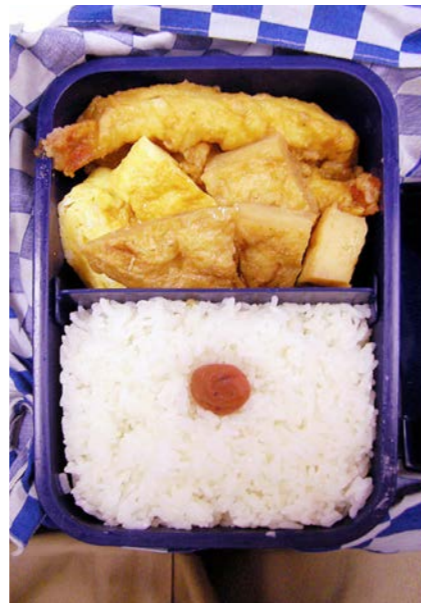
06/10/10/tue 海老天ふら/玉子焼/天ふら/梅干し