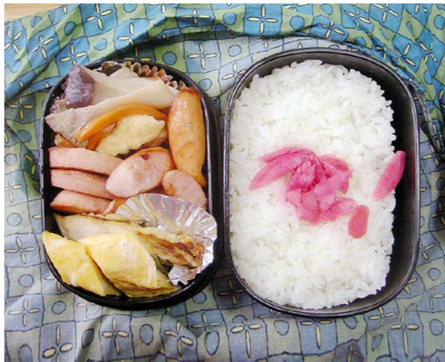
10/12/28/tue 玉子焼／魚肉ソーセージ／ウインナー／塩サバ／紅ショウガ エリンギ・ニンジン・油揚げ煮

前日が仕事納めなのに弁当がある。間違えて作ってもらったのだろうか？(会社にもちょっと寄ってはいるが)