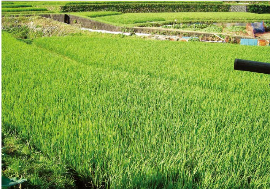
2007.8.7 tue 8:03