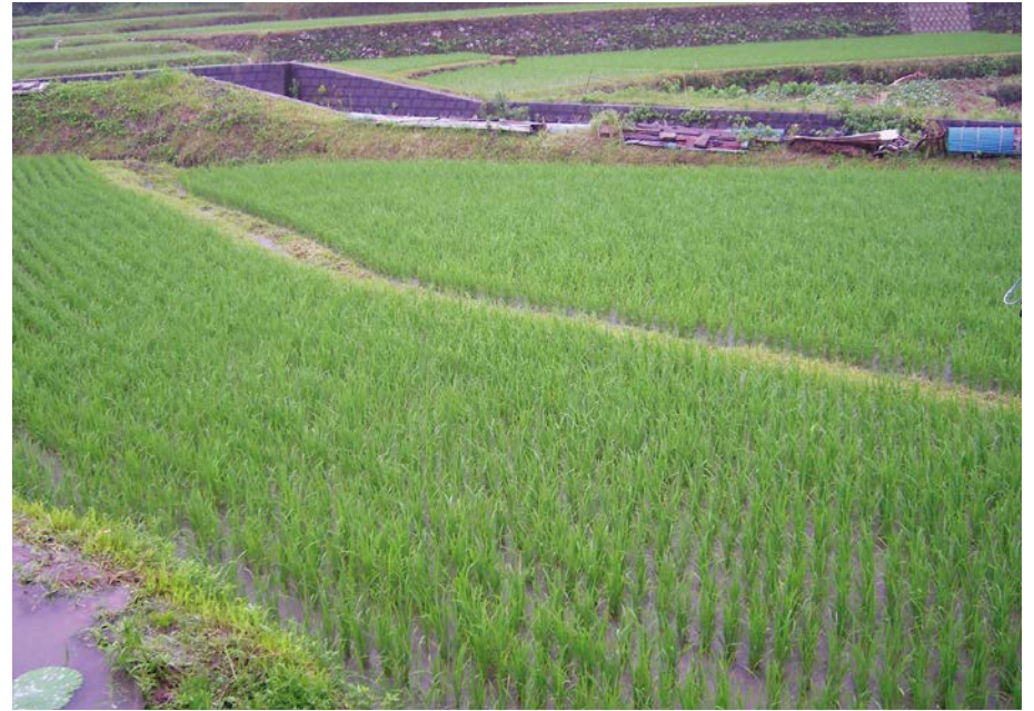
2007.7.4 wed 8:11