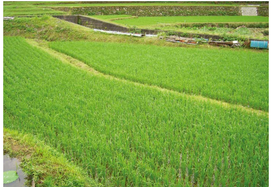
2007.7.5 thu 8:07