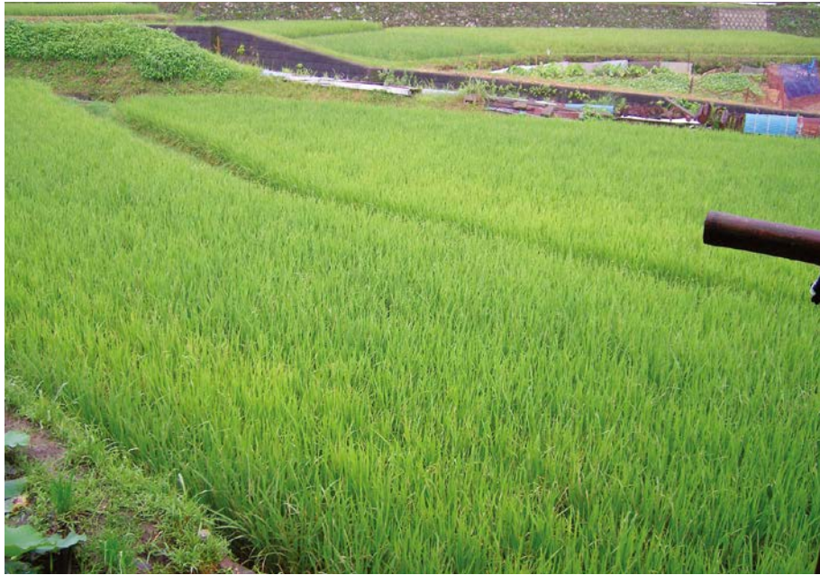
2007.8.3 fri 8:09