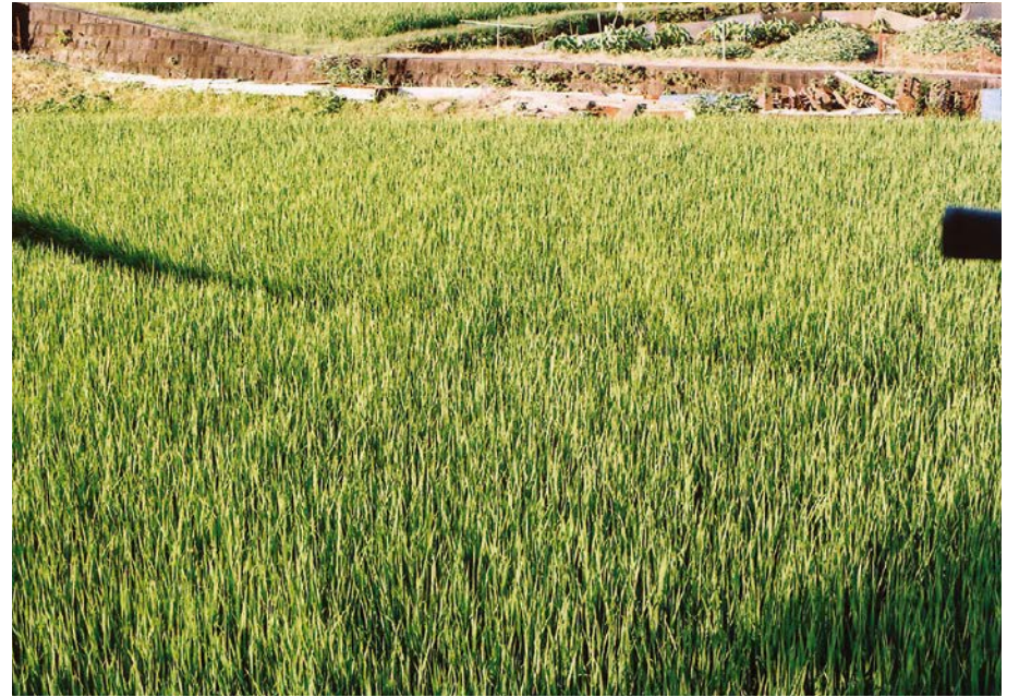
デジカメ故障によりここから銀塩カメラ撮影→プリント写真スキャニング