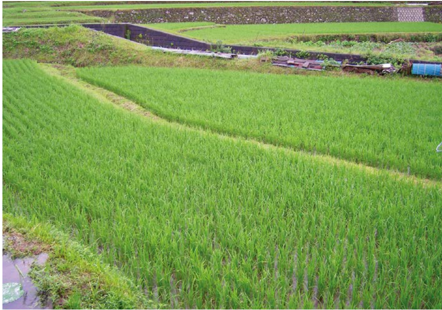
2007.7.6 fri 8:06