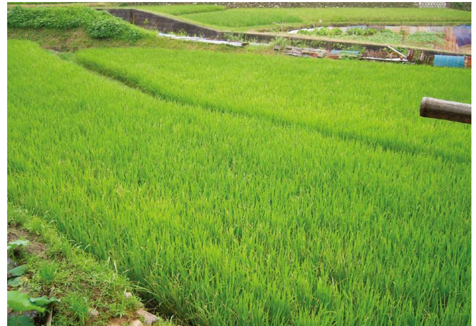
2007.8.2 thu 8:13