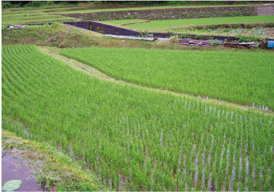
2007.7.2 mon 8:26