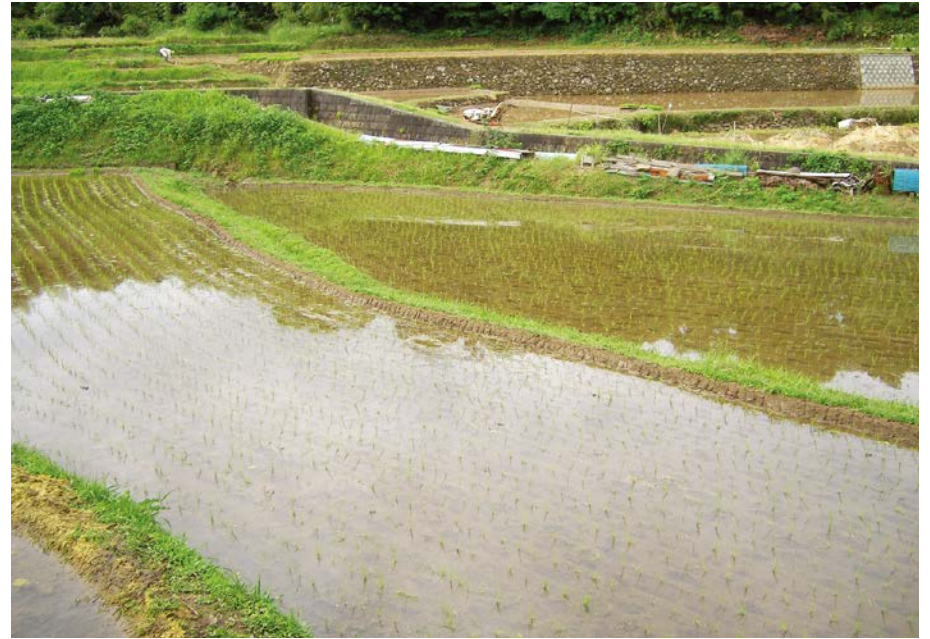
2007.6.4 mon 8:33