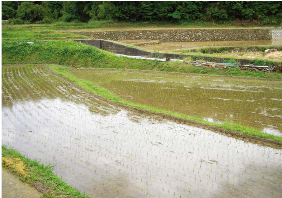
2007.6.3 sun 13:49