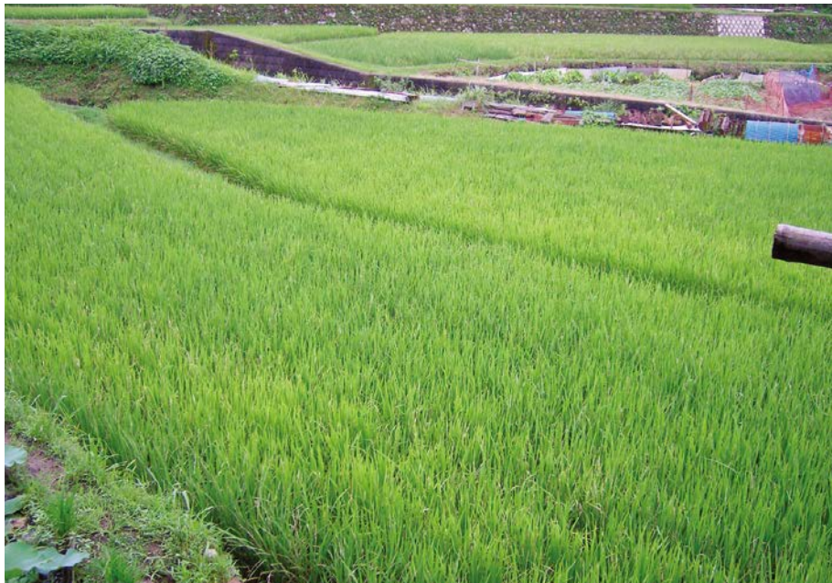
2007.8.4 sat 7:17