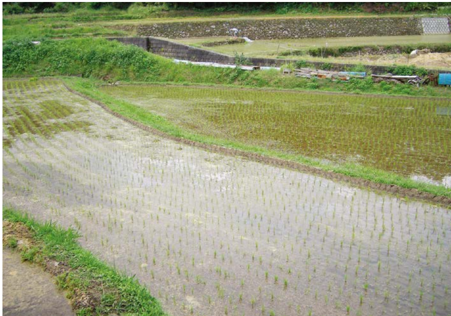
2007.6.9 sat 10:07