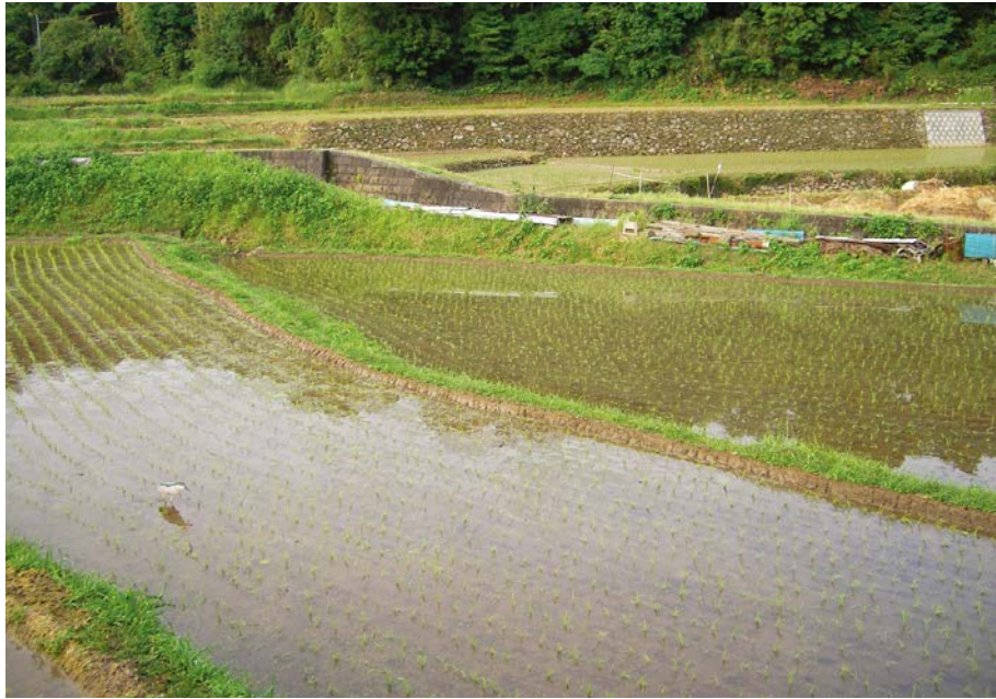
2007.6.6 wed 6:54 左下に鳥がいる