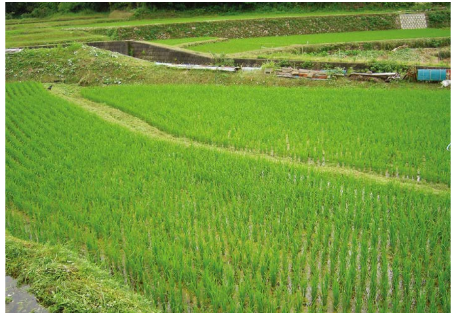
2007.7.1 SUN 8:33