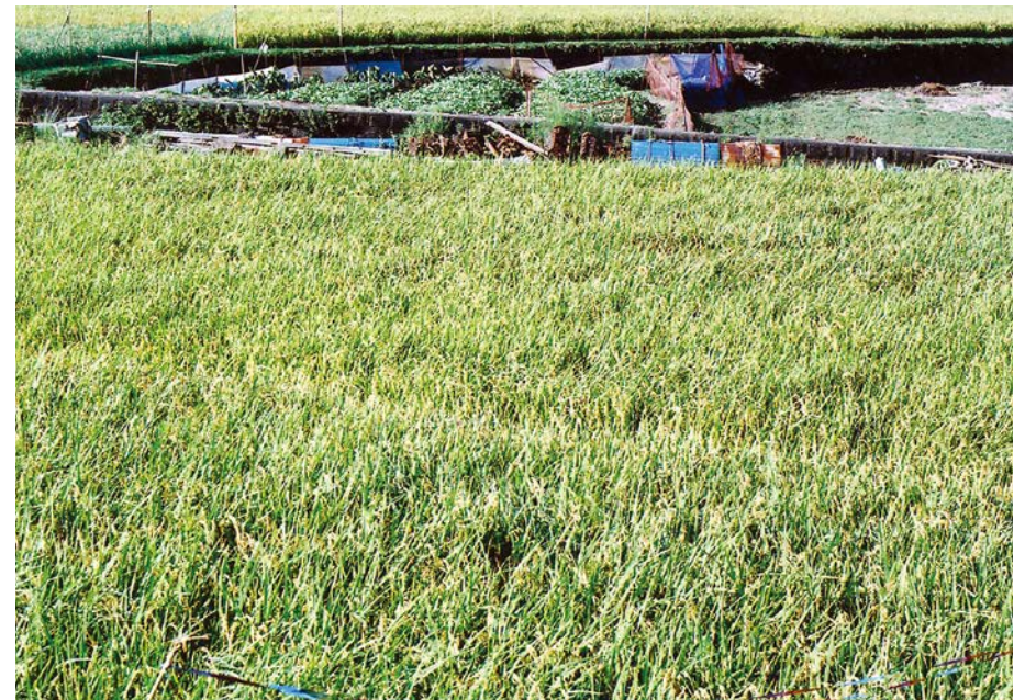
9/24は前日からの会社泊まりにより未撮影