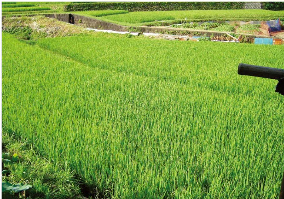
2007.8.8 wed 8:16