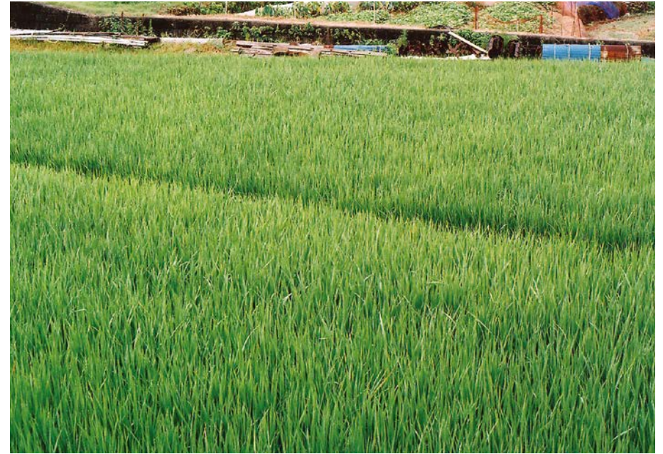
8/19は旅行中につき未撮影