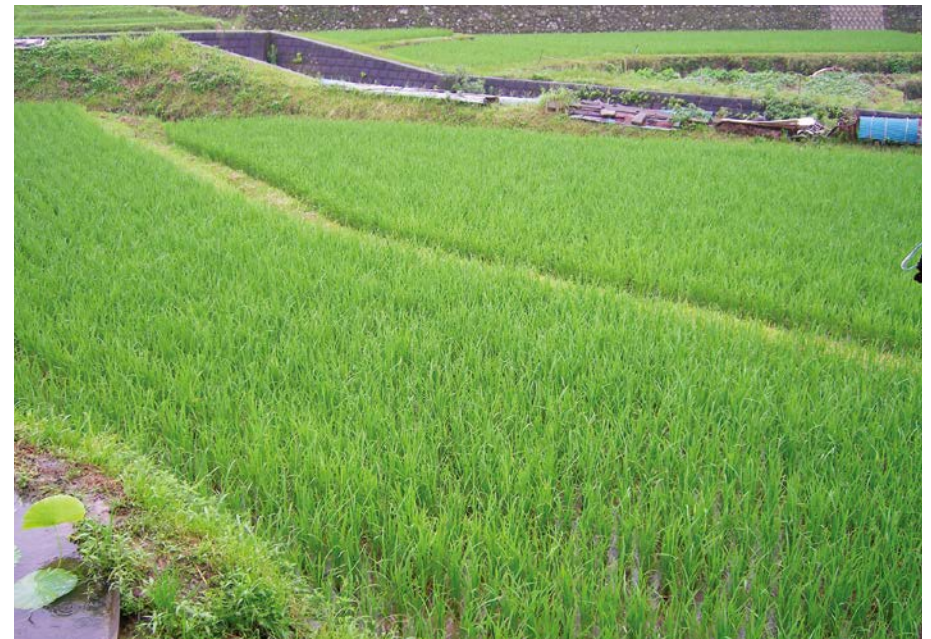
2007.7.9 mon 7:59