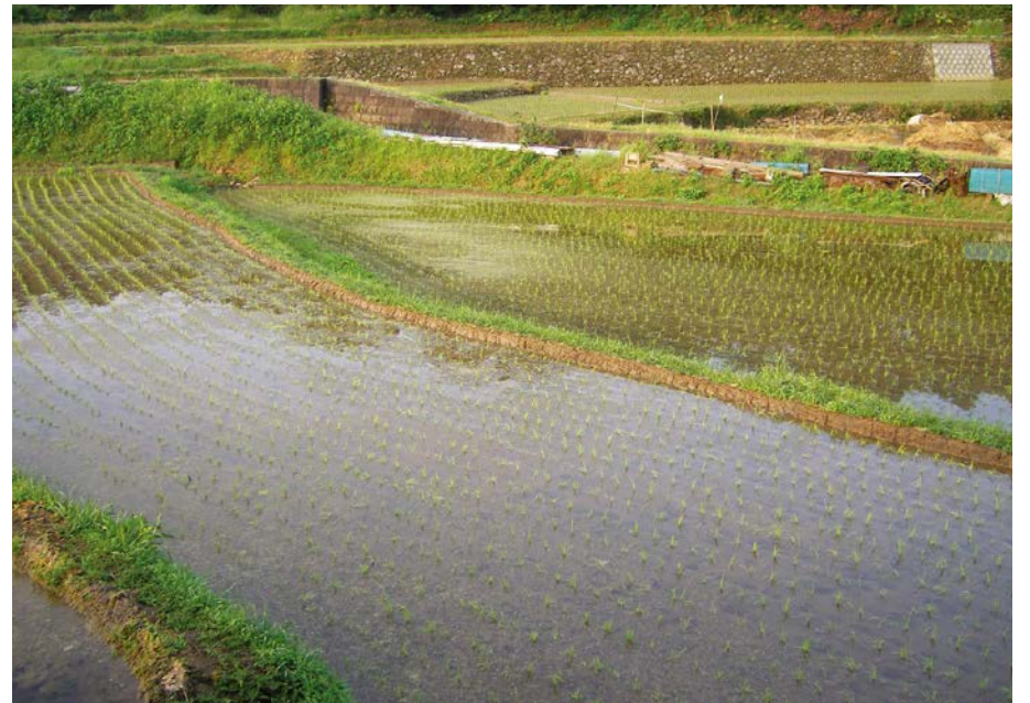
2007.6.7 thu 6:30