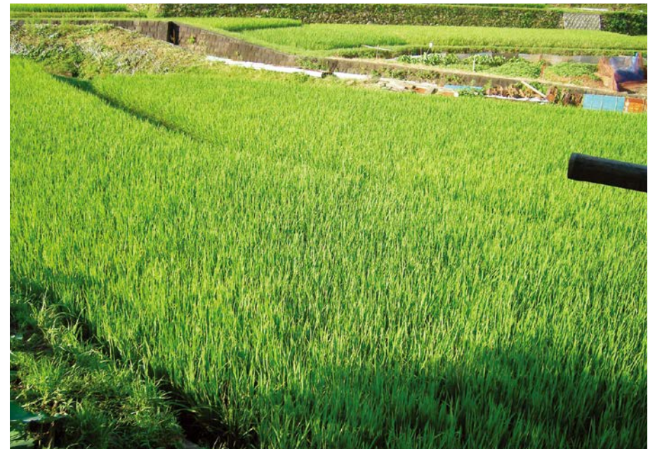
2007.8.6 mon 7:35