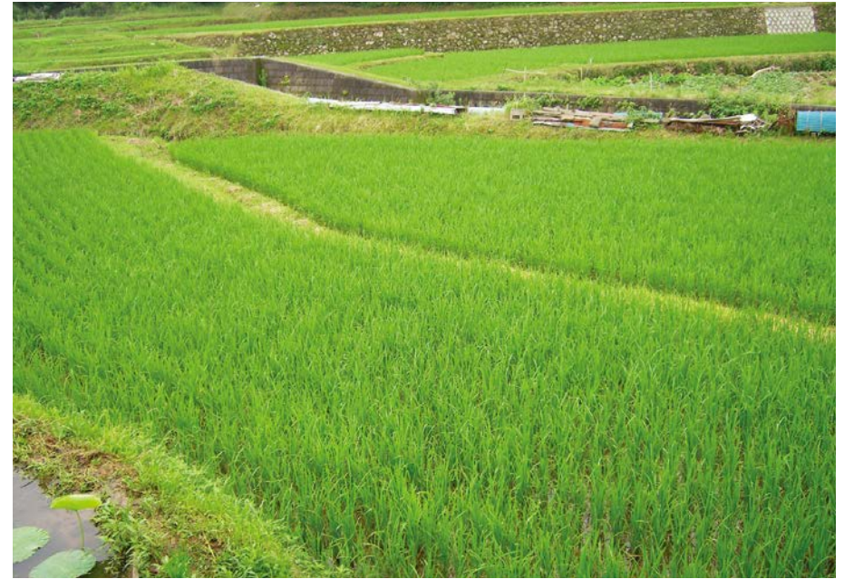
2007.7.8 sun 7:56