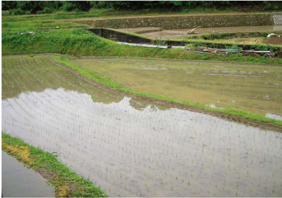
2007.6.2 sat 11:01