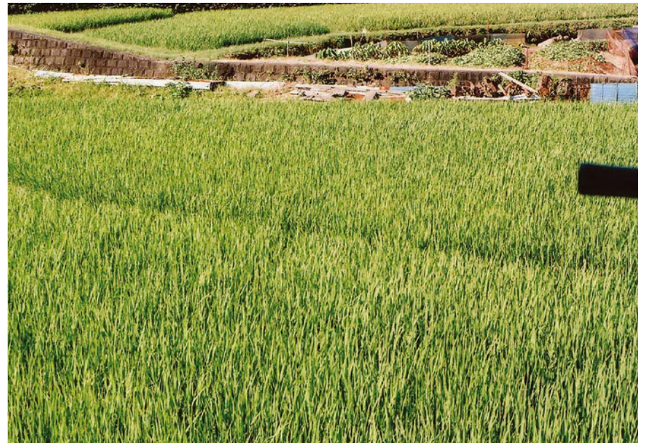
以降の撮影時間はおおむね夜明け~午前8時半(平日)