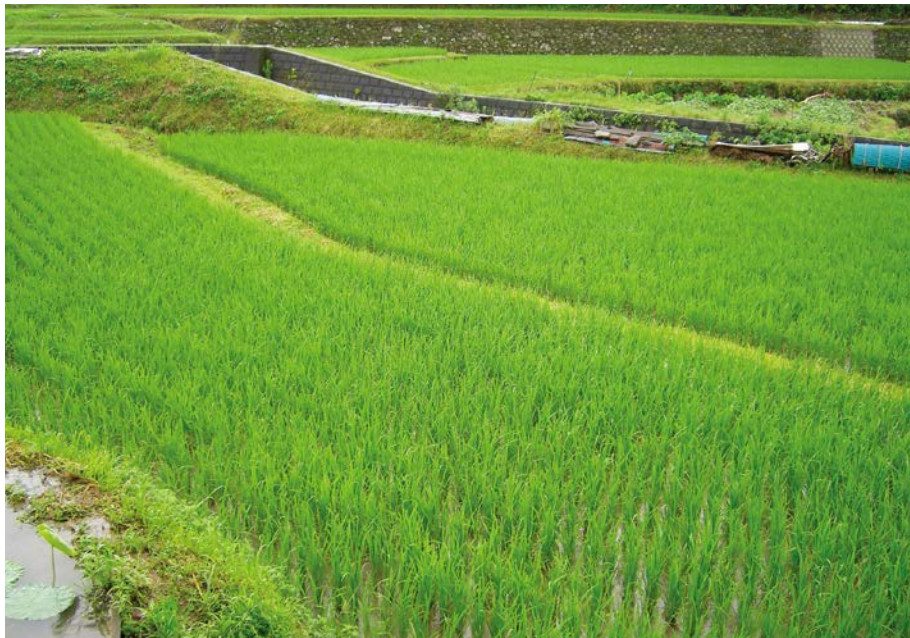
2007.7.7 sat 8:34