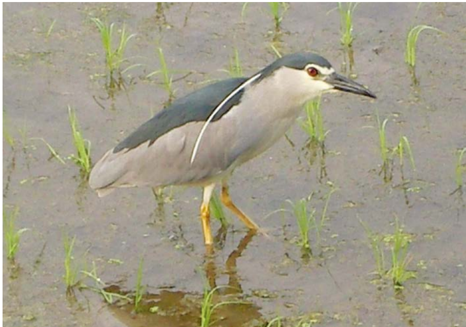
2007.6.6 wed 6:54 ズームして撮る。ゴイサギだった