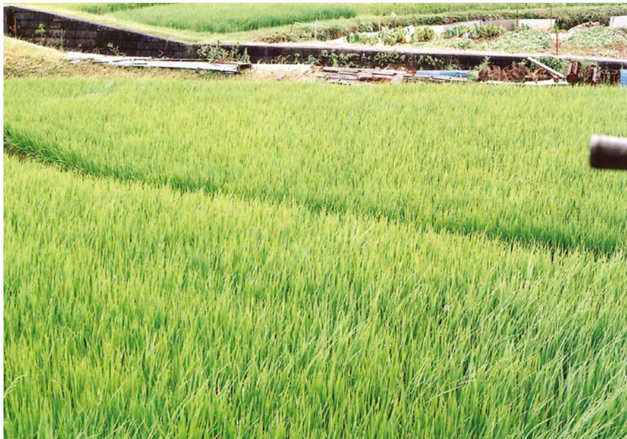
2007.8.14 tue 8/12~13は旅行中につき未撮影