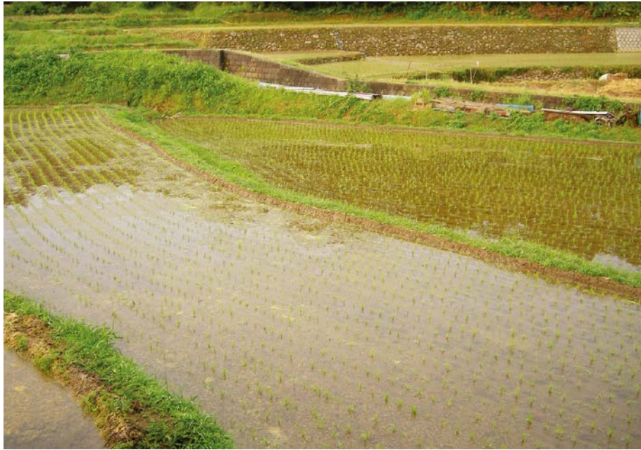
2007.6.8 fri 6:22