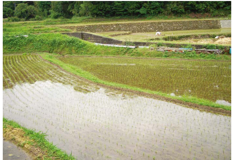
2007.6.5 tue 8:10