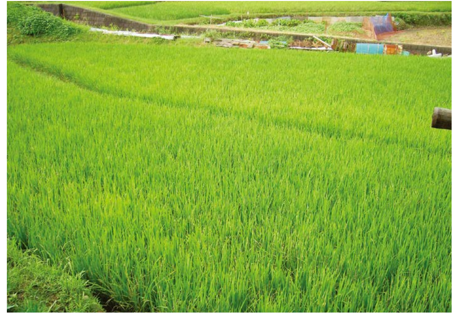
2007.8.5 sun 8:26