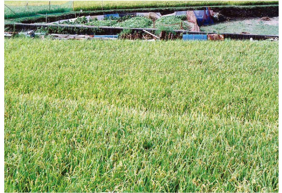
9/22は前日からの会社泊まりにより未撮影