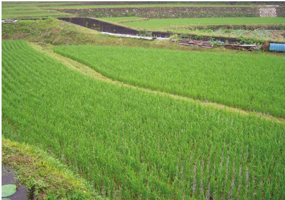
2007.7.3 tue 7:13