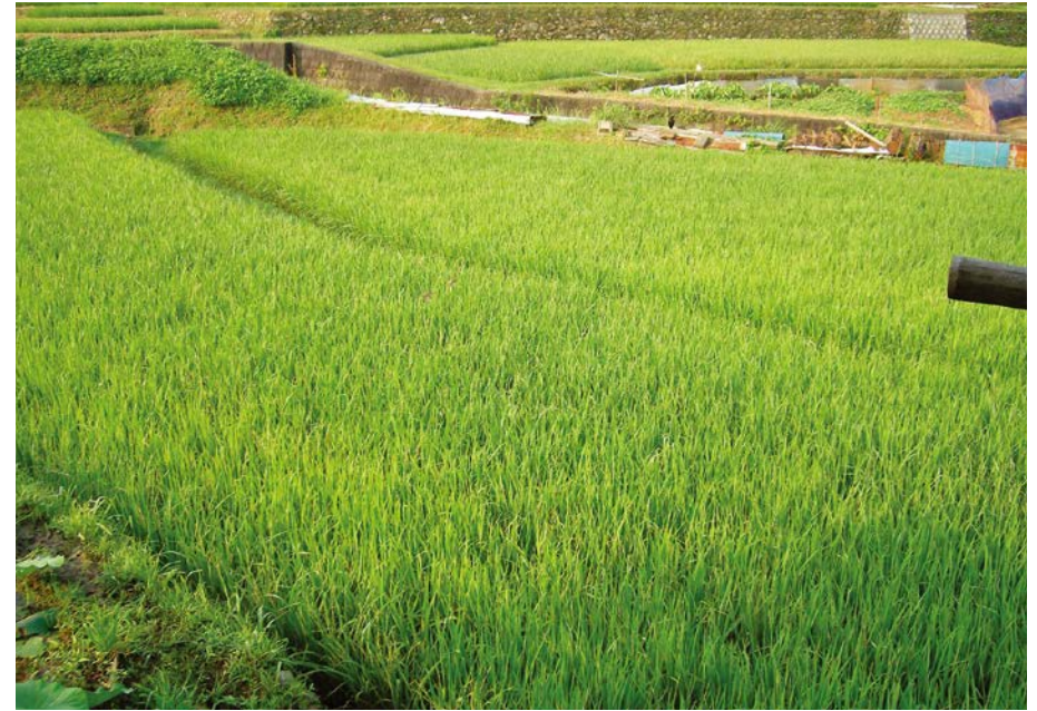
2007.8.1 wed 7:29