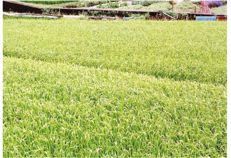
9/1は夜明け前休日出勤～日没帰宅により未撮影